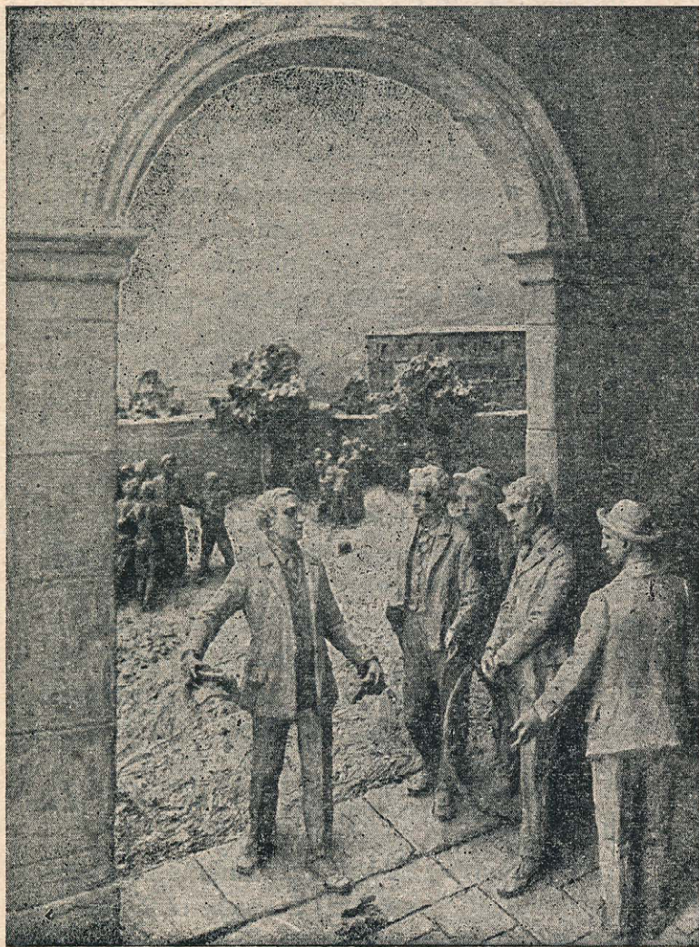
SAVIO DOM. STRGA SLAB ČASOPIS.

Sv. oče me je blagovolil imenovati danes za kardinala sv. katoliške cerkve. Globoko ginjeno se moje srce obrača k Tebi, draga mati, in Tebi pišem prvo pismo. Ko premišlujem prečudna pota, po katerih me je vodila božja previdnost, stopi vedno Tvoja slika pred mojo dušo. Bolje nego vsi učeni vzgojitelji si Ti v duše svojih