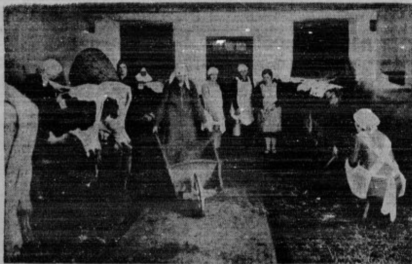
Gojenke gospodinjke šole v Repnjah pri praktičnem gospodinjstvem pouku.