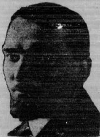
Italijanski zunanji minister Grandi, ki je zastopal Italijo v zunanji politiki od leta 1929, je odstopil. Njegov naslednj bo vodil zunanje politične posle Mussolini sam.