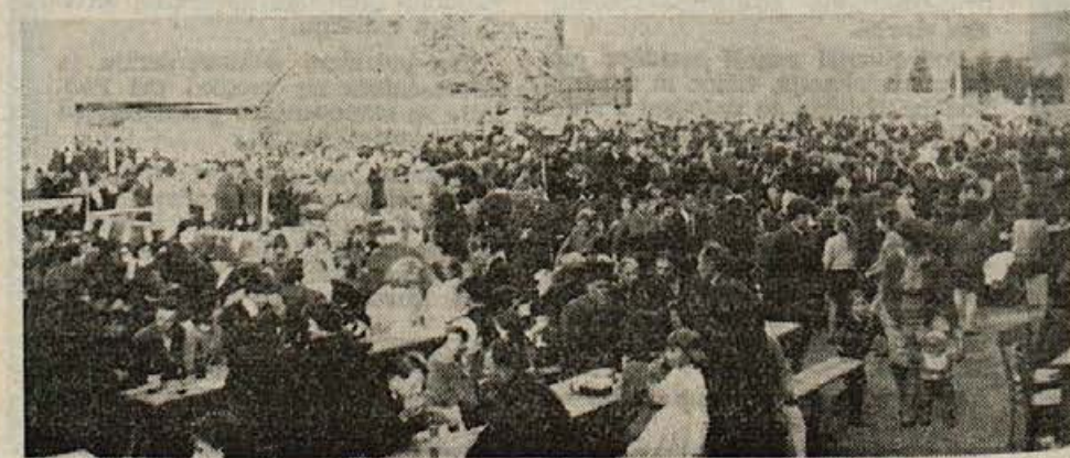
Razvitje prapora krajevne organizacije ZB v Skocjanu, ki je bilo 1. maja, je privabilo v Skocjan veliko množico ljudi in se je spremenilo v pravi ljudski praznik.

tutov, ki so bili poslani v obravnavo občinski skupščini. Nikogar ne nameravamo »raztrgati«, hočemo samo opozoriti, da ne spada vse v statut, česar se med sestavnimi deli Statuta je zakon delovne organizacije, zato naj bo precizen, konkreten, predvsem pa — slovenski.