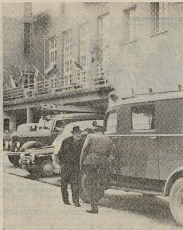
Pravkar izšolani gasilski podčastniki iz Sevnice, Krškega in Brežic so si 17. aprila ogledali opremljenost operativne enote PGD Sevnica. Na sliki je sevniški gasilski dom, pred njim pa vozila v pripravljenosti