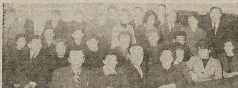
V prostorih brežiške gimnazije se je pred kratkim odvijal 80-urni tečaj prve pomoči, ki ga je organiziral občinski odbor Rdečega križa. Tečaj pod vodstvom dr. Aleksičeve je uspešno končalo 25 slušateljev iz različnih brežiških kolektivov. Razen tega potekajo 20-urni tečaji prve pomoči po vseh osemletkah.

Občinski komite Zveze mladine vabi mestno prebivalstvo, naj se sprejema štafete udeležijo polnoštevilno in tako pripomore, da bo prireditve bolj slovesna. Tudi mesto naj tisti dan dobi praznično podobo, zato naj iz vseh hiš zaplapolajo zastave!