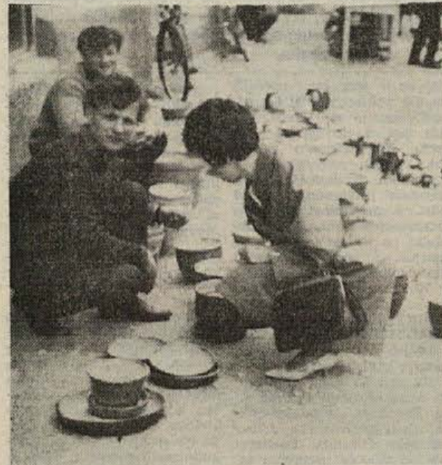
Na brežiški trg prihajajo lončarji vsako soboto prodajati svoje izdelke. Največ prinašajo cvetličnih loncev, ki jih brežiške gospodinje pridno kupujejo.