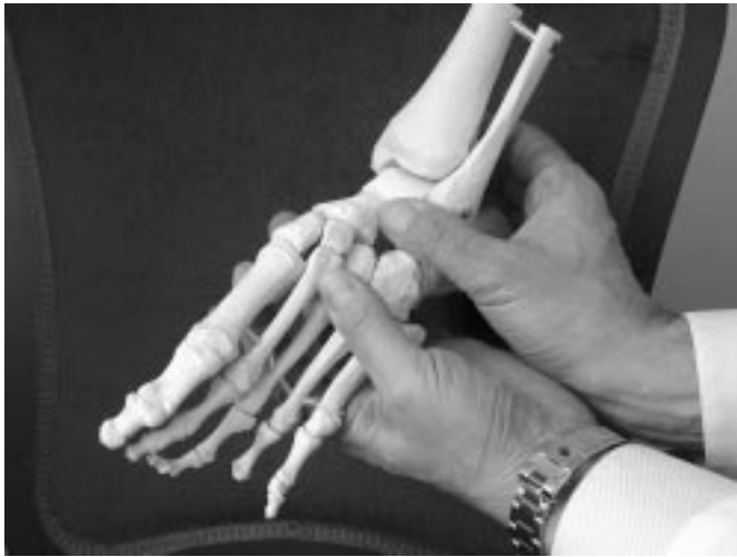
Sl. 2. Redresija po Ponsetiju (pogled iz lateralne strani). S palcem desne roke je pritisnjen lateralni del vratu talusa pred lateralnim gležnjem, leva roka dviguje prvo metatarzalo in potiska stopalo v smer abduktusa, petnica ni redresirana.

Figure 2. Manipulation according to Ponseti (lateral view). Pressure of the right thumb is maintained on the lateral aspect of the talar neck in front of the lateral malleolus, the forefoot is abducted while dorsiflexion of the first ray is maintained, the heel is not constrained.