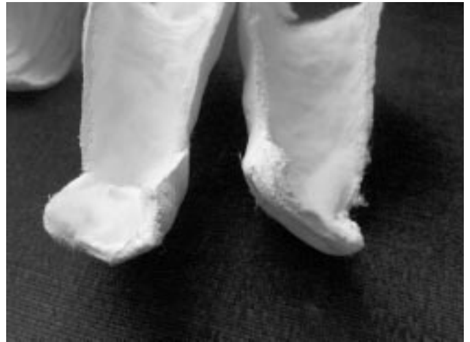
Sl. 1. Redresijski longeti. Longeta za levo stopalo je na sliki na desni strani, stopalo je v supinaciji, abdukciji in ekvinusu, prva metatarzala je dorziflektirana (redresija po Ponsetiju). Longeta za desno stopalo: stopalo je v nakazani pronaciji (do izpred treh let uporabljan način redresije).

Figure 1. Correction casts. Cast for the left foot is on the right side, the foot is in supination, abduction and equinus, first metatarsal is dorsiflexed (manipulation by Ponseti). Cast for the right foot: the foot is in slight pronation (this kind of manipulation was abandoned three years ago).