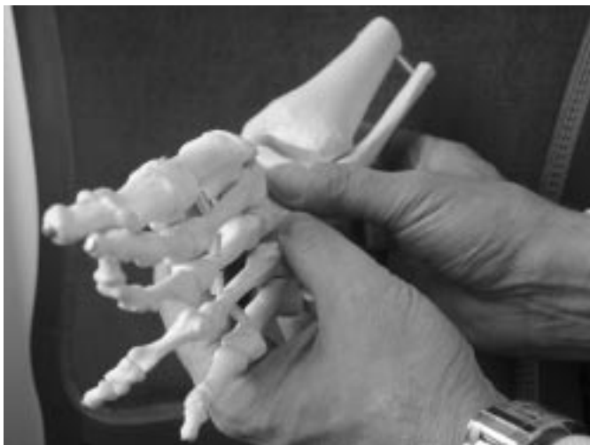
Sl. 3. Redresija po Ponsetiju (pogled od spredaj). Pritisnjen je lateralni del vratu talusa, okrog katerega je redresirano stopalo, ki je v supinaciji in abduktusu.

Figure 2. Manipulation according to Ponseti (lateral view). Pressure of the right thumb is maintained on the lateral aspect of the talar neck in front of the lateral malleolus, the forefoot is abducted while dorsiflexion of the first ray is maintained, the heel is not constrained.