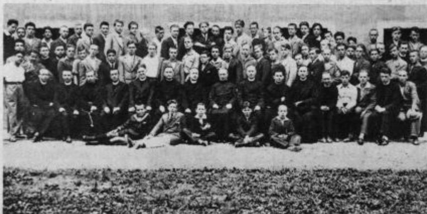
Zborovanje delegatov dijaških Marijinih kongregacij v Celju

Zoper tretje zlo naj pomaga častitljivi rožni venec, ki nam kaže v boljše, onostransko življenje, kamor smo namenjeni vsi, zakaj »nimamo tukaj stalnega bivališča, marveč prihodnjega iščemo« (Sv. Pavel). Po skrivnostih sv. rožnega venca po-