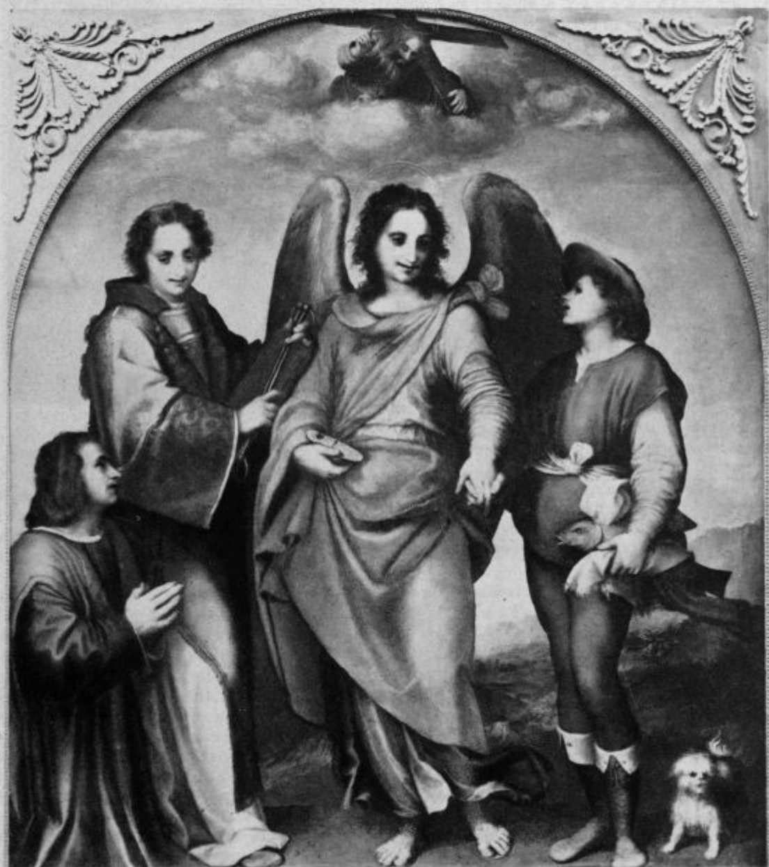
A. del Sarto.

najskem apostolu, beremo, da je v moč sv. rožnega venca brezmejno zaupal. »Od vsega, kar imam, se rad ločim,« tako je često dejal, »le od brevirja in svojega rožnega venca bi se ne mogel.« Iz svoje bogate apostolske skušnje je pripovedoval, da si upa spreobrniti tudi najbolj zakrknjenega grešnika in rešiti še tako težko zadevo, ako le more preje zmoliti svoj rožni venec. Podobno vemo iz življenja sv. Vincencija Pavelskega. Sv. Frančišek Ksav. je s svojim rožnim vencem delal vsakovrstne