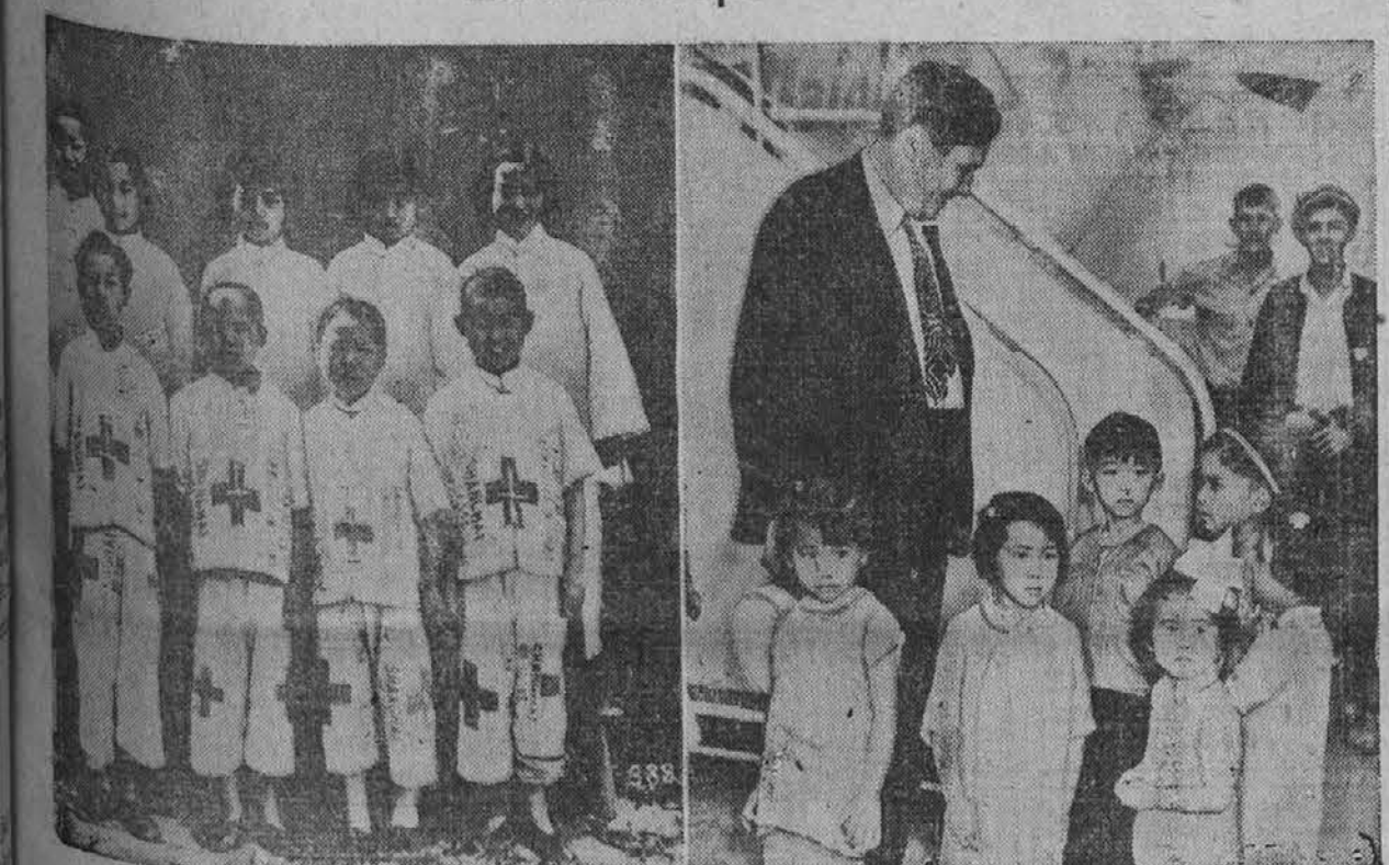
Na levi so kitajski otroci v presbiterijskemu misijonu v Kašingu, Kitajsku, za katere skrbi ameriška dobrotelost. Na desni pa je Wendell Willkie s skupino kitajskih otrok v Ameriki, ki se je nabralo pet milijonov dolarjev.