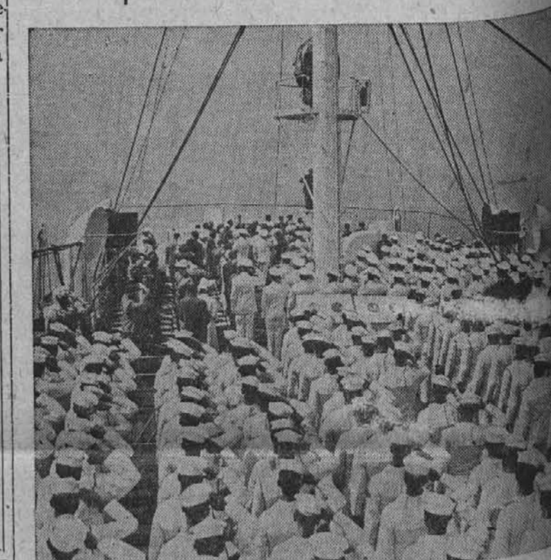
Pogled na moštvo nove bolniške ladje Solace, ki je bila te splovljena v ladjenici v Brooklynu, N. Y. Na ladji je postelj za bolnike in ranjence, 13 zdravnikov in trije dentisti.