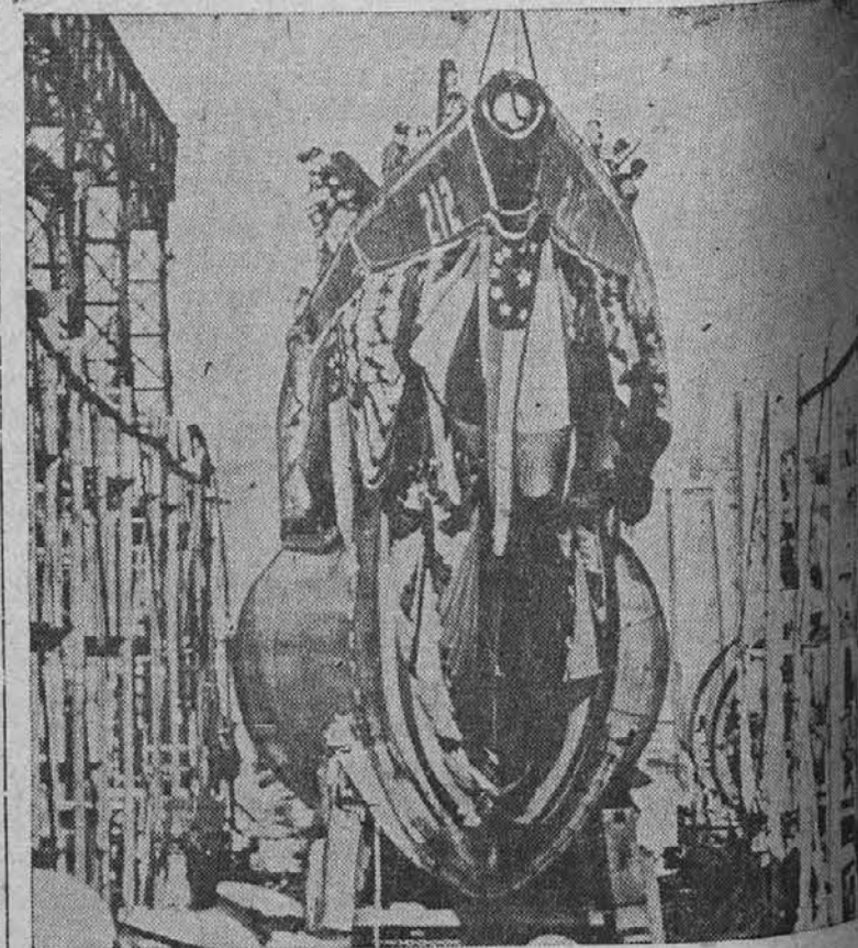
Na sliki vidimo splovitev nove podmornice Gato, ki je stala $3,000,000. Podmornica, ki je bila za to priliko slavnostno okrašana, je bila splovljena v New Londonu, Conn.