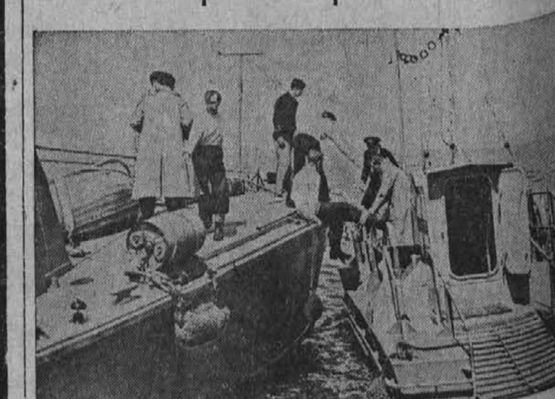
Na sliki vidimo angleške mornarje, ki pregledujejo tisto zvano "bujo," katerih je več zasidranih v Rokavskem prelivu drugod. Te skrambe imajo udobno notranjost, kjer so potniki živili in zdravila kakor tudi radio aparat, s katerih pomočjo ponesrečeni letalci lahko javijo svojo pozicijo.