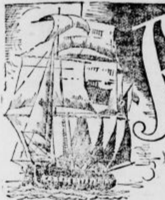
Drugo potovanje na Gvinejo in morski razbojnik.