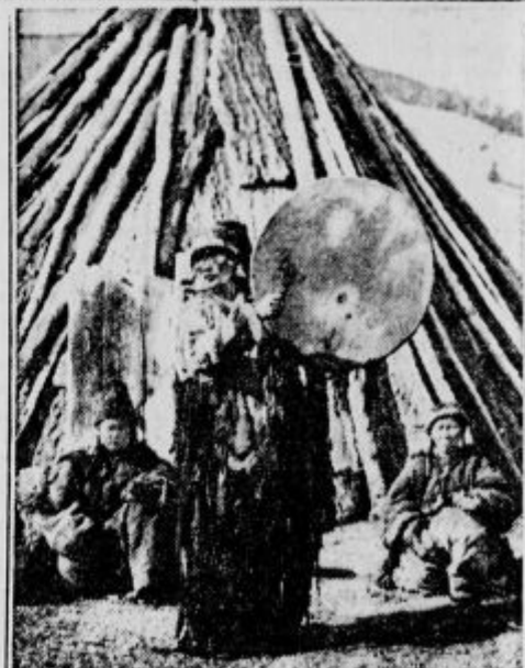
Egoraj: Katun, eden od obeh izvirkov veletoka Ob, nedaleč od altajskega sela Cemal. — V sredini: Altajska vas Černi Anuj, ki ima večino ruskih naseljencev, kar kaže tudi oblika stanovišč. — Levo spodaj: Velika altajsko-ruska vas Čepra. — Desno spodaj: Altajski šaman — godba s plesom.