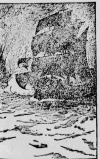
Boj s morskimi razbojnik

Medtem ko je naša ladja plula mimo Kanarskih otokov ali bolje med Kanarskimi otoki in afriško celino, so jo nekega jutra presenetili in napadli turški morski razbojniki. Ko smo zapazili, da prihajajo proti nam z razvitimi jadrji, smo tudi mi razvili vsa jadra in jim skušali ubežati, kakor beži golob, ko zagleda sokola. Toda ladja razbojnikov je bila urnejša od naše in prostor med obema ladjama je postajal vedno manjši. Ni nam kazalo drugega, kakor da se pripravimo na oboroženo obrambo. Naša ladja je imela dvanajst topov, na jadrnici morskih razbojnikov pa jih je bilo osemnajst. Poleg tega pa jo na njihovi ladji bilo več mož, ki so bili bolj izvežbani za boj, kot pa