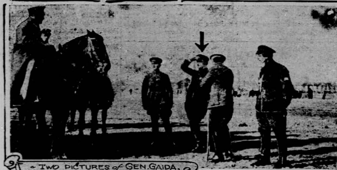
TWO PICTURES OF GEN. GAIDA, LEADER OF VLADIVOSTOK RISINGS JUST PUT DOWN BY LOYAL KOLCHAK TROOPS