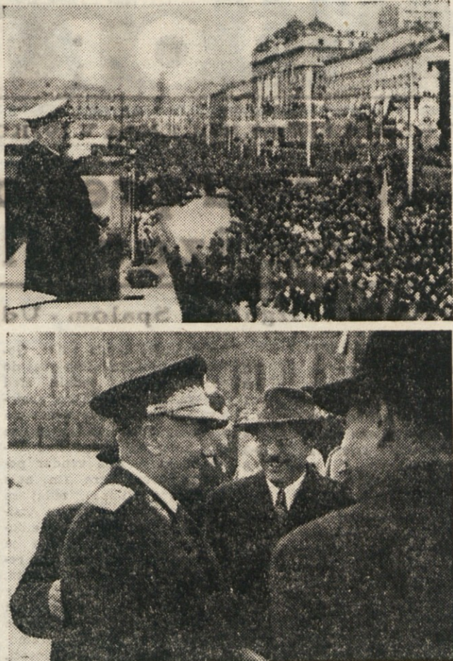
Predsednik Jugoslavije Tito se je vrnil s svojega potovanja v Indijo in Burmo. Na Reki ga je dočakala velika množica 120.000 ljudi, da bi ga pozdravila (slika zgoraj). Na spodnji sliki vidimo marsala Tita, ko se na beograjskem kolodvoru pozdravlja s tovaršem Kardejem.