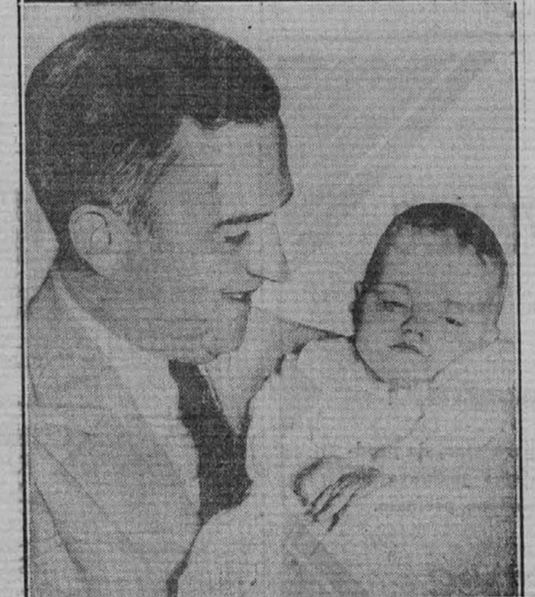
Pred kratkim se je pred nekim čikaškim sodiščem obravnaval slučaj, ko je neka bolnišnica ohdržala novorojenega otroka, ker oče ni mogel plačati stroškov. Sednik pa je odločil, da se mora otrok takoj vrniti očetu, poleg tega je pa še zagrozil ravnatelju bolnice z ječo.