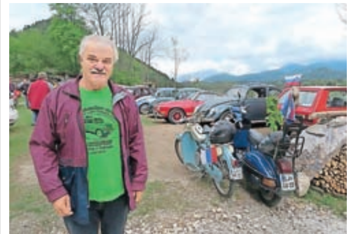
Pri Tonetu Rajsarju Na hribčku se je tudi letos zbralo več kot trideset starodobnikov.

trideset voznikov starodobnih avtomobilov in motorjev. Udeleženci so se najprej podali na 25 kilometrov dolgo pot mimo Laz, Zgornjega Tuhinja, Buča, Hruševke, Raven, Potoka, Srednje vasi in Sidola, nato pa so se znova zbrali Na hribčku, kjer je sledilo družabno popoldne.