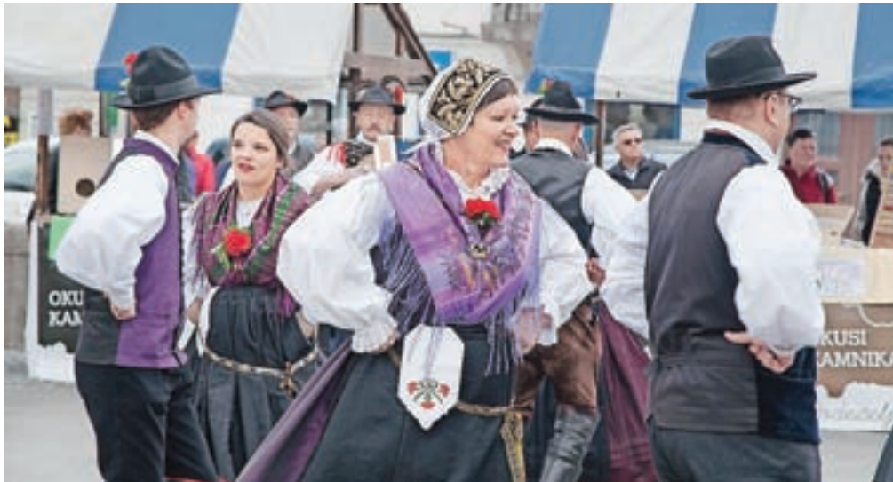
Člani Folklorne skupine Kamnik bodo nastopili tudi na regijskem srečanju folkloristov.

Najnovejši splet se imenuje Kdo je boljši, saj ples prikazuje tekmovanje dveh skupin v plesu. Odplesali ga