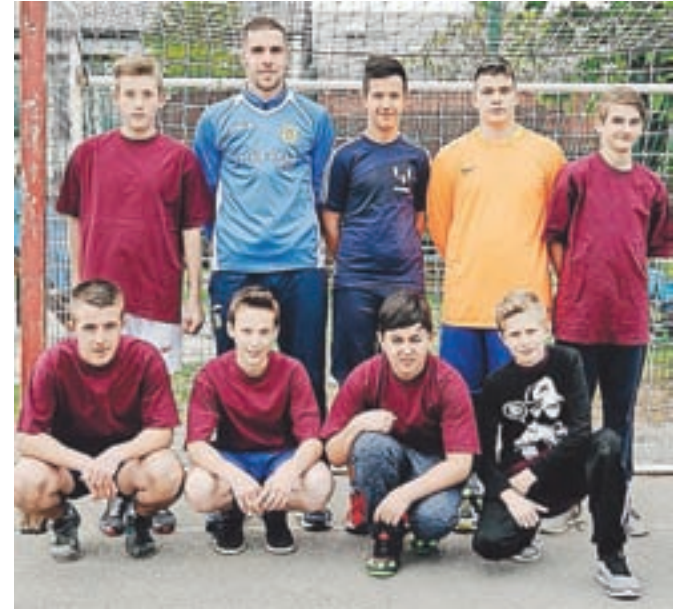
Učenci OŠ 27. julij Kamnik so na področnem tekmovanju osvojili tretje mesto.

Učenci Osnovne šole 27. julij Kamnik so se v aprilu v Domžalah udeležili zanimive prijateljske tekme z učenci Osnovne šole Roje.