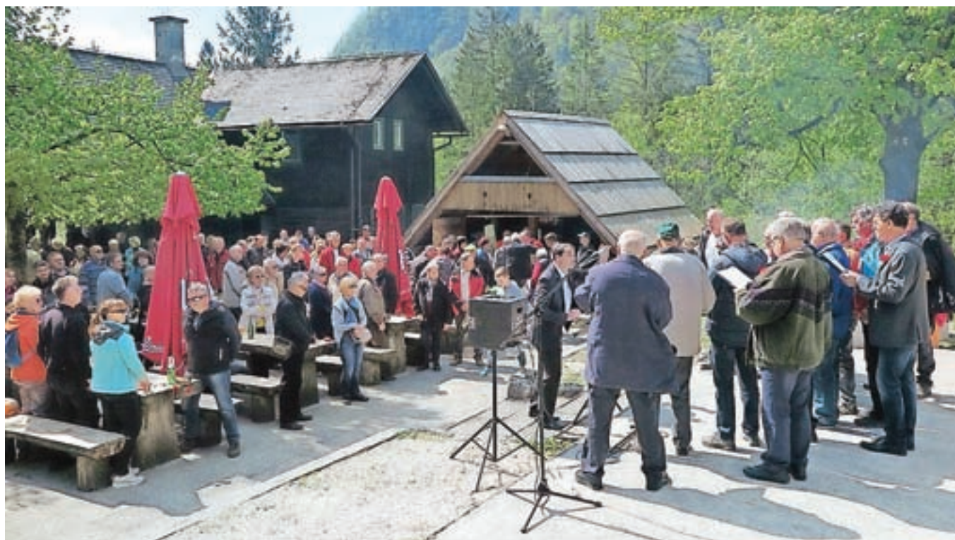
Prvomajsko proslava je v Kamniško Bistrico privabila okoli tristo ljudi, ki so v uvodu lahko prisluhnili delavski himni Internazionali v izvedbi pevcev DKD Solidarnost.

dobrih proizvodov in storitev. Dobri proizvodi in storitve se dobro prodajajo, kar omogoča dobre plače in sredstva za nadaljnji razvoj podjetja. Žal smo v preteklih dvajsetih letih videli tri faze 'prihvatizacije', ko so ljudje, ki jih je vodil pohlep, postali lastniki podjetij. Zanimal jih je samo dobiček, ne pa tudi pogoji dela zaposlenih. To niso odgovorni lastniki podjetij. Današnja sporočilnost 1. maja je prav zaradi njih še toliko večja. Politika, sindikati in delodajalci smo dolžni storiti več za izboljšanje delovnih pogojev in plač delavcev v prihodnje,« je med drugim dejal Matej Tonin. Ne glede na to, da so bili tudi v Kamniški Bistrici le redki obiskovalci prepričani, da prvomajška srečanja še imajo takšno moč kot nekdanj in da se bodo pravice delavcev zaradi tovrstnih shodov kaj izboljšale, pa je bilo čutiti jasno sporočilo – prvomajsko praznovanje bo v Kamniški Bistrici tudi prihodnje leto, in to že 95. leto zapored.