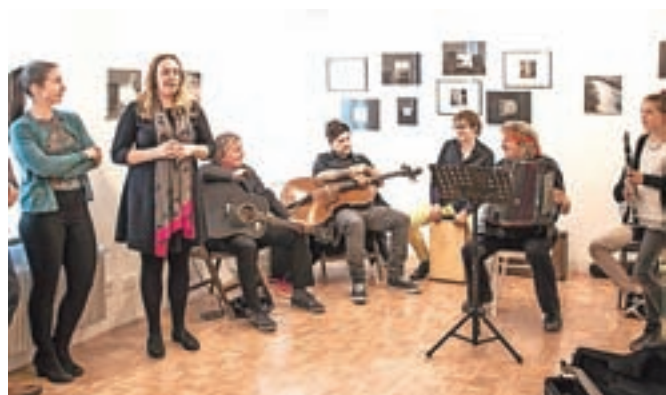
Odprtje razstave v četrtek, 20. aprila, je popestrila glasbena skupina Kontrabant, fotografije pa bodo na ogled do 12. junija.

Fotografije kot enostavni "snap shoti" nastajajo posamično, a nastopajoče v paru harmonično postanejo idealen par. Kustosinja razstave Saša Bučan opisuje, kako je Šakti daleč pred čisto navadnim ljubiteljem fotografije – platno in čopič sta njen fotoaparati, njene zgodbe pa široke za vsakega posebej, za tisoče interpretacij.