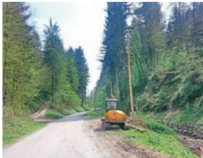
V sklopu rekonstrukcije daljnovoda Črna so po številnih krajih občine – tudi v kraju Laniše – zamenjali tudi vrsto dotrajanih lesenih drogov.

Občina Kamnik v zadnjih tednih občane pogosto obvešča o izpadih električne energije, vzrok pa je obsežna rekonstrukcija daljnovoda Črna, ki ga izvaja družba Elektro Ljubljana.