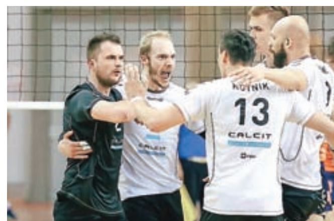
Kljub porazu na zadnji tekmi je za kamniškimi odbojkarji odlična sezona.

Odbojkarji Calcita Volleyballa so bili po letu 2003, ko so zadnjič osvojili naslov državnega prvaka, letos najbližje najpomembnejši odbojarski lovoriki. Na odločilni, peti tekmi končnice 1. DOL so morali priznati premoč ACH Volleyju.