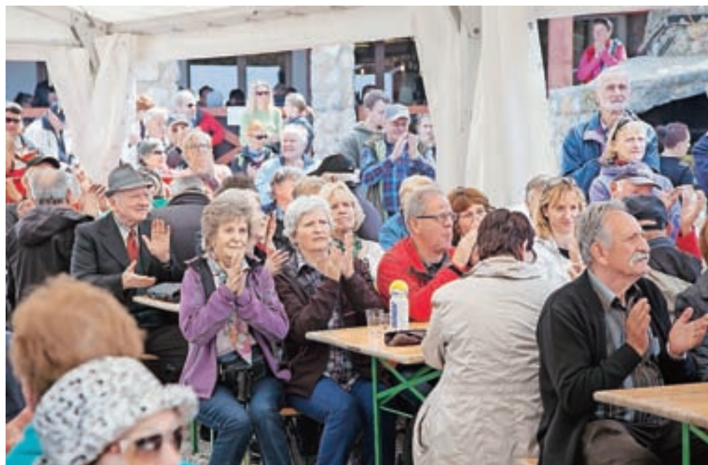
Praznovanje na Starem gradu je pospremlilo več sto obiskovalcev.