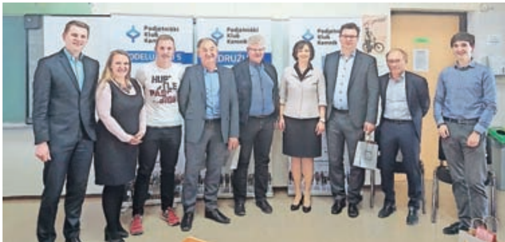
Udeleženci okrogle mize o podjetništvu na Gimnaziji in srednji šoli Rudolfa Maistra Kamnik