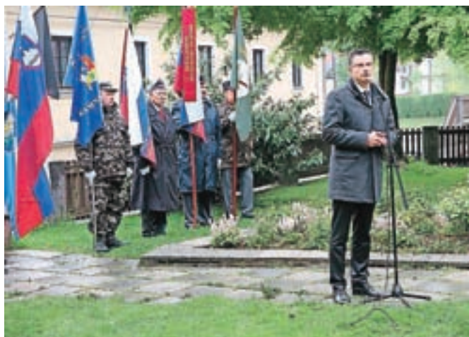
Župan Marjan Šarec in zastavonoše, ki so poskrbeli za slovesno vzdušje.

K slovesnemu vzdušju so pripomogli člani Mestne godbe Kamnik, številni zastavonoše in Združeni kamniški pevci in recitatorji.