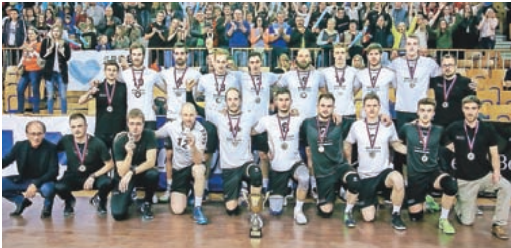
Kamničani so drugo mesto osvojili ob glasni podpori domačih navijačev.