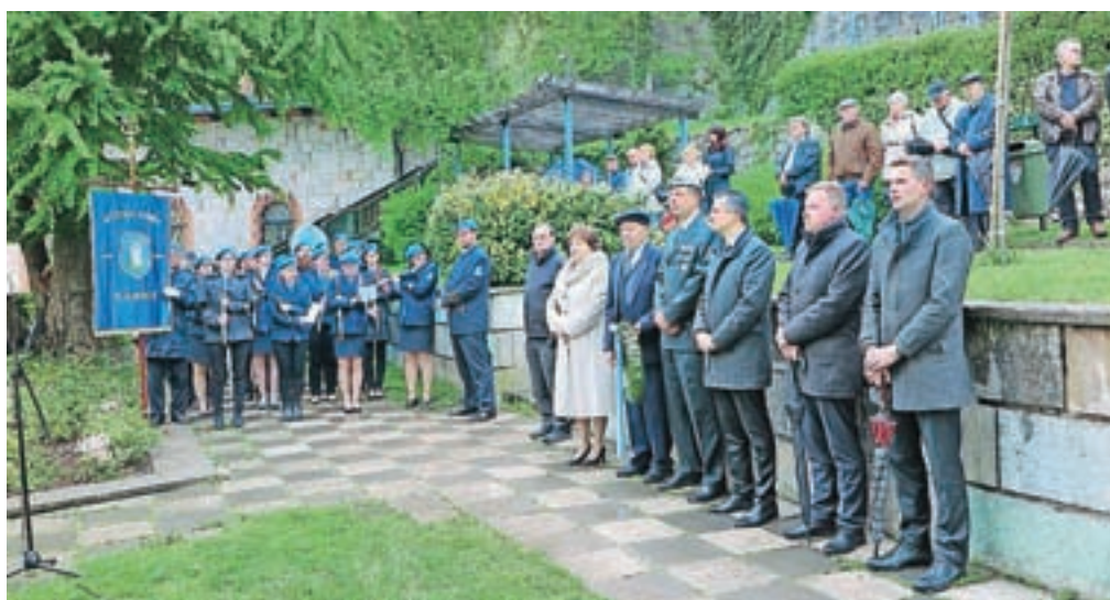
Proslava v Parku Evropa je bila dobro obiskana.