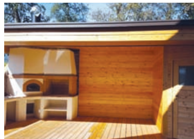
Mobilna hiša z vrtnim kaminom in savno

Skeletna gradnja zunanjih in notranjih sten je kombinirana z lesom in železom. Zunanja obloga je iz dvojne OSB-plošče debeline 12 mm, parapropustne folije in lesene fasade. Notranja obloga pa je iz OSB- in mavčne plošče debeline 12 mm. Izolirana je s kameno volno. Streha je enokapnica iz železne in lesene konstrukcije. V kopalnici so tla položena s PVC-jem (dimljen hrast), kuhinja in sobi pa sta opremljeni s parketom Jaso (hrast). Okna in vrata so iz lesa, ki ga kupec sam izbere (smreka, macesen ipd.). Okna imajo termo