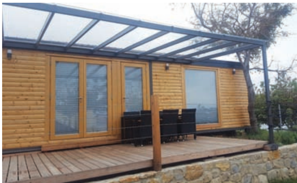
Mobilna hiška Snežka

Malo pred Bledom se nahaja tematski park z dinozavri. Tam so postavili mobilno hišo s teraso, ki služi kot okrepevalnica (mobilna hiša-bar), in trgovino s spominki in igračami (mobilna hiša-trgovinica). V okolici Jesenic so na vrtu postavili hiško, v kateri je savna in pergola z vrtnim kaminom (mobilna hiša-savna). Mobilna hiša je lahko urejena tudi kot vrtna uta, pripravljajo pa tudi večje projekte za večje hiše do tlorisa 130 m 2 .