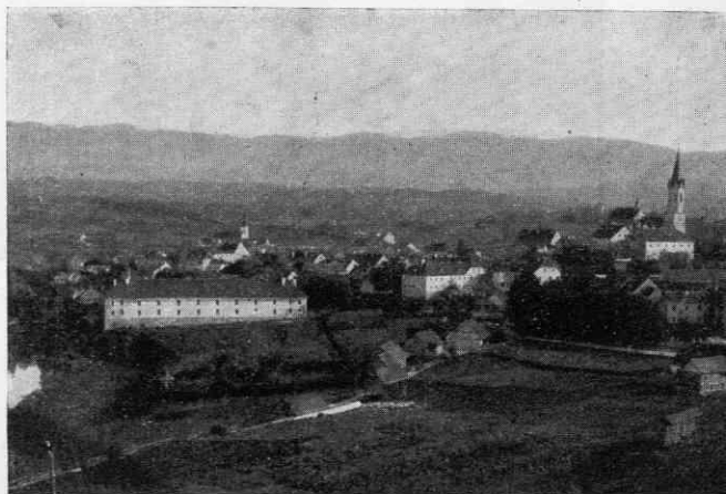
Novo mesto s Kapiteljskega hriba (okoli l. 1880)

Novomeški Glavni trg se je Ketteju zelo priljubil, pogosto je hodil tja, opazujoč vrvenje