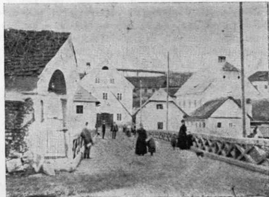
Stari most čez Krko konec XIX. stol. Pogled proti Kandiji

Drugi del soneta izzveni v poveličanje Angeline lepote, ki je tako očarljiva, da bi vzdrhtela celo hladna Krka do podzemeljskih izvirov, če bi poznala sredi teh domov bivajočo »devet