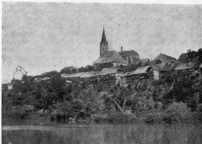
Novo mesto — Breg

Kettejevo razmerje do sošolcev in dijakov nižjih razredov je bilo tovariško ljubeznivo. Čeprav je bil takrat že upoštevan pesnik, ni bil prav nič ošaben in domišljjav. Ni jih gledal z viška,