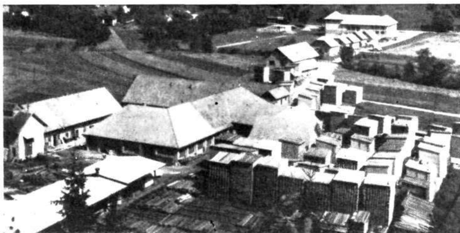
Medzadružno lesno industrijsko podjetje v Cešnjici z zadržnim domov v ozadju

Menda se z istimi težavami bori prav tako mlado in mnogo obetajoče Medzadružno lesnoindustrijsko podjetje »Cešnjica«. Tudi tu je družbeno upravljanje pokazalo že lepe rezultate, kar se zlasti vidi v dvigu delovne storilnosti. S svojimi obrati: zabojarno, mizarno, sodarno ter uslužnostnimi obrati (avtopark, mehanična delavnica, hidro- in termoelektrarna, žaga) podjetje že zdavnaj teži po razširitvi, saj sedanji tesni, natrpani, nehiigienski prostori ne morejo več predstavljati dobrih delovnih pogojev. Če hočejo v podjetju res do skrajnosti izkoristiti plan predelave hlodovine v finalne izdelke, je moderen, sodoben obrat prvi pogoj. Kljub navedenim težavam, ki tarejo delavce z direktorjem Janezom Prevcem, predsednikom delavskega sveta Janezom Habjanom in upravnega odbora Jožetom Blaznikom na čelu, pa je podjetje že doseglo zavidljivo višino in si je s svojimi kvalitetnimi