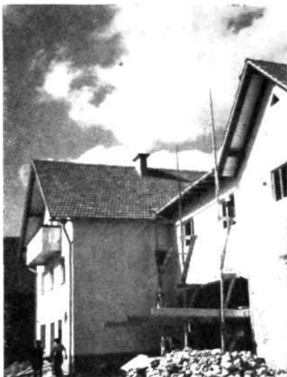
Poslopje kmetijske zadrage v Dražgošah pred dograditvijo

Vsak dan jih uporabljate — risalne žebličke »Atlantic«, spojnice za papir »Mephisto«, spojnice za stroj, luknjače, pisemske odpiralce, pa še vrsto drugih pisarniških potrebščin. Precizna in natična seštila, laboratorijski pribor. — centri-