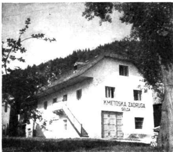
Novo gospodarsko poslojje Kmetijske zadruge v Selcah

Iz navedenega je razvidno, da se v letu 1956 predvideva porast družbenega proizvoda za 10,1%, kar je v glavnem rezultat povečane industrijske proizvodnje ter povečanja družbenega proizvoda v obrti, v manjši meri tudi v gostinstvu, dočim je pri kmetijski proizvodnji računati z zmanjšanjem družbenega proizvoda. Če nekoliko podrobneje analiziramo te podatke, bomo ugotovili, da se bo v obrti zvišal družbeni proizvod v primeri z letom 1955 za 17,5%, predvsem zaradi višjega plana v obrtnem podjetju Selca in zadružnem podjetju »Ratitovec« iz Studenega, čeprav delata obe podjetji v zelo slabih okoliščinah (pomanjkanje ustreznih strojev, iztrošenost, neprimerni prostori itd.). Posebno pereče je vprašanje vajencev (razen v obrtnih delavnicah KZ) in se je bati, da bo v bodoče primanjkovalo kvalificirane delovne sile. Vsa investicijska sredstva pa naj ta podjetja usmerijo v izboljšanje opreme ter naj z uvedbo norm in premij pa tudi z boljšo organizacijo dela izboljšajo svojo proizvodnjo, s čemer bodo laže zadovoljili rastoče potrebe (stanovanjska izgradnja!), na drugi strani pa zavrli precej razširjeno sušmarjenje.