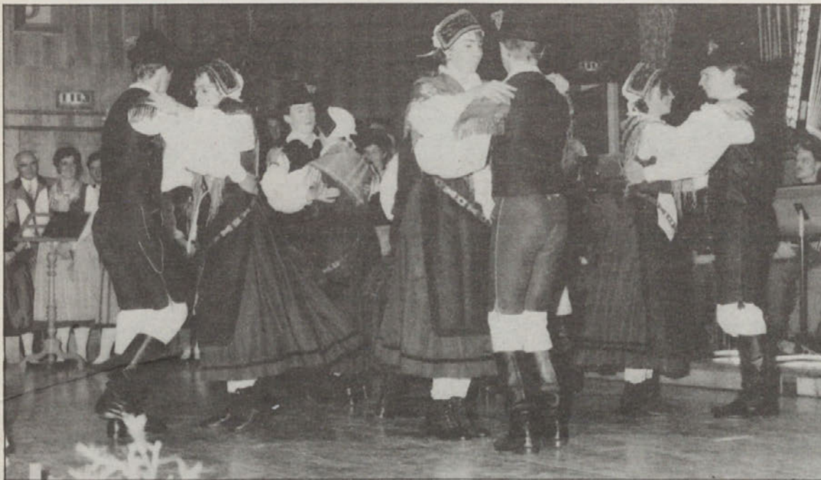
Folklorna skupina iz Globasnice je predstavila nekaj domačih plesov.