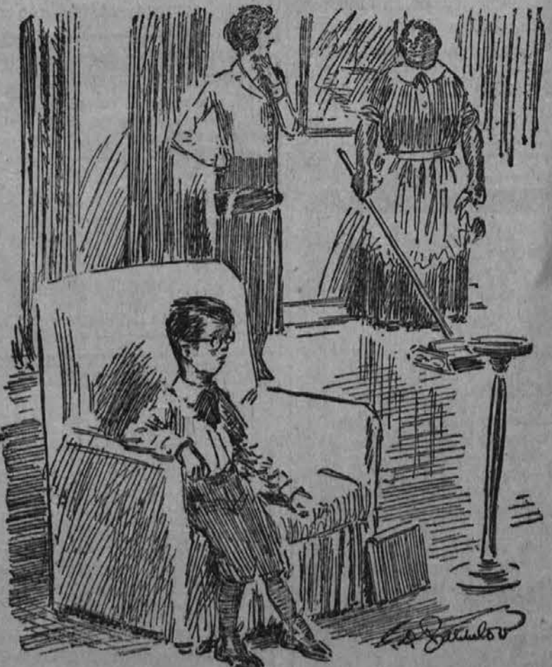
MANY A TRUE WORD IS SPOKEN IN ERROR "U. now, Dinah, Bertram was born after his father's death." "Oh, Mrs. Smith, that makes him one of dem post humorous children."