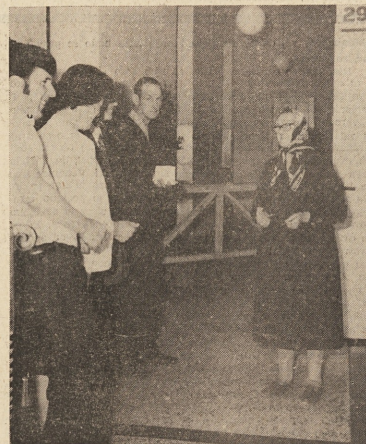
Na volišču v Bazovici

V nedeljo in včeraj smo izvolili nov deželni svet dežele Furlanije - Julijske krajine. Volitve so potekale mirno, kot je pri nas tradicija že vrsto let, če ne upoštevamo manjših in izoliranih poskusov provociranja desničarskih elementov. Volilne izide objavljamo na drugem mestu, tu pa naj zapišemo, da so zleteli slovenski volivci v zelo visokem odstotku opravili svojo državljansko dolžnost in še enkrat pokazali svojo politično zvestost s tem, da so glasovali za kandidate, ki so že v preteklih mandatnih dobi dokazali, da so vredni zaupanja. Zastopstvo Slovencev v deželnem svetu žal ne ustreza našemu številnemu sorazmerju, vendar pa nas v naših pravičnih zahtevah po globalni zakonski zaščiti naših narodnih interesov podpirajo tudi predstavniki naprednih strank v deželnem svetu. Na slikah posnetki z volišč v slovenskih vaseh, kjer je večina volila že v nedeljo dopoldne, lepi popoldanski dan pa so mnogi izkoristili za izlete na zeleni Kras in v kraje onkraj meje