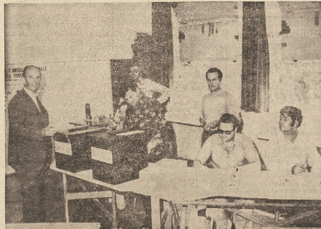
Na volišču pri Domju