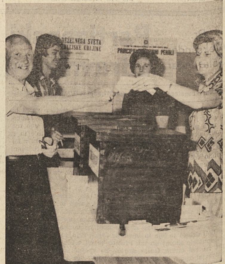
Na volišču v Boljuncu