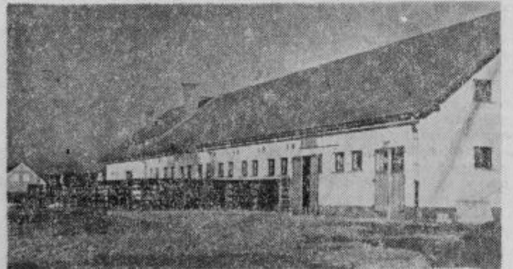
Nova zgradba Živnoredsko-veterinarskega zavoda v Ptuj

GENERAL BURNS NA PLITVIČKIH JEZERIH Poveljnik sil Zdrženih narodov na Sinaju General Burns, ki preživlja del svojega dopusta v Jugoslaviji, je odpotoval včeraj z letalom iz Dubrovnika na Plitvička jezera. General Burns si je v dveh dneh ogledal zanimivosti Dubrovnika in bil na dveh predstavih Dubrovnških letnih iger.