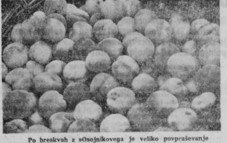
Po breskvah z »Osojnikovega« je veliko povpraševanje

Ptujsko KG »Osojnik« je, kot že rečeno, s svojimi breskvami znano po Jugoslaviji in v inozemstvu. Do sedaj so jih izvažali predvsem v Avstrijo in Nemčijo in tudi letos upajo, da bodo z njimi prislužili nekaj desettisoč dinarjev. Kvalitetnim breskvam bodo pridružil še zlatina jabolka in hruške. Čeže pa, da jih tudi na našem ptujskem trgu ne bo zmanjkalo.