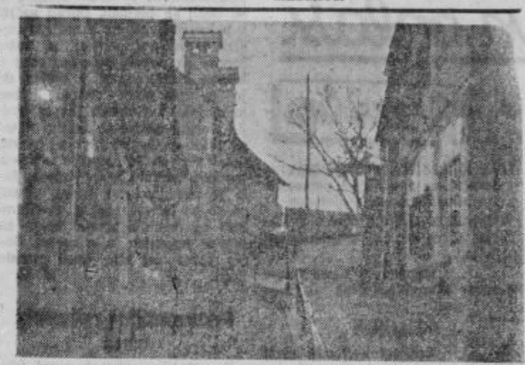
Pot na grad v Ptujju vodi turista in izletnika tudi po ozkih starih ulicah.

potem »Umetnost zapadne Evrope« (Zbirka »Kosmos«, 1935). Za ptujsko področje je važna knjiga »Ptujška gora« (1940). Tudi drugače je Stelč mnogo pisal o pomenu Ptujja v umetnosti. Omeniti moramo še Malovo Zgodovino umetnosti pri Slovencih, Hrvatih in Srbih, Lj. 1924.