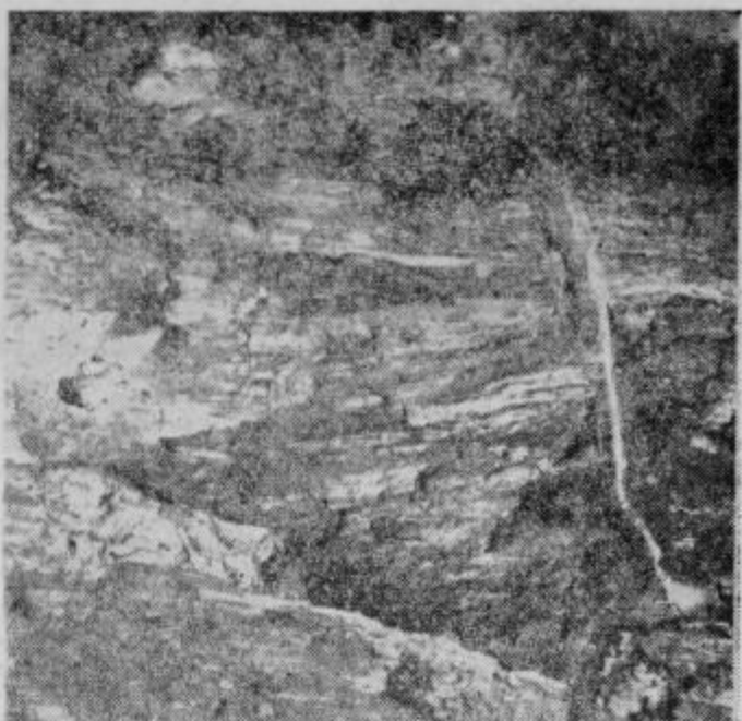
Skočjanska jama vabi med obču dovalce svojih zanimivosti tudi Ptujčane.