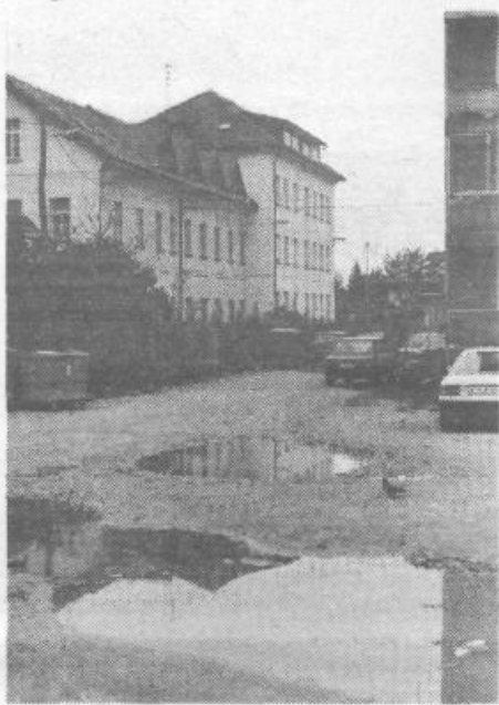
Bloki v Zavetiški se lahko ogledajo v lužah

Precej vprašanj iz te krajevne skupnosti pa še vedno zadeva tudi asfaltiranje odnošno protiprašno obdelavo Mencingerjeve ulice ter dela Velebitske in