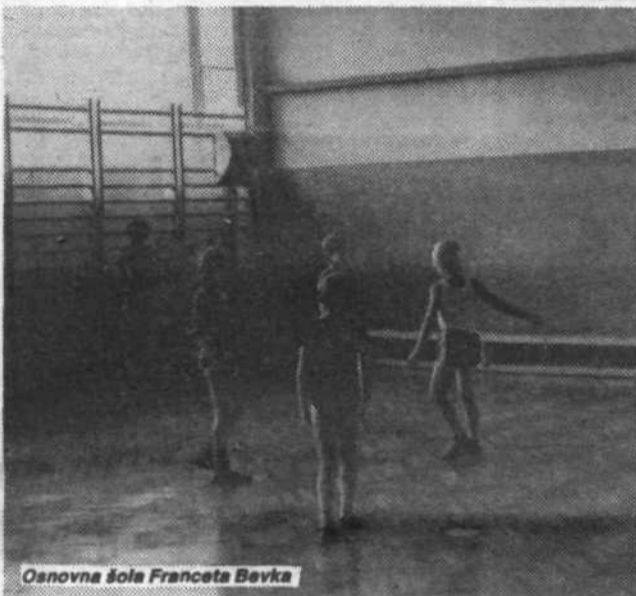
Osnovna šola Franceta Bevka