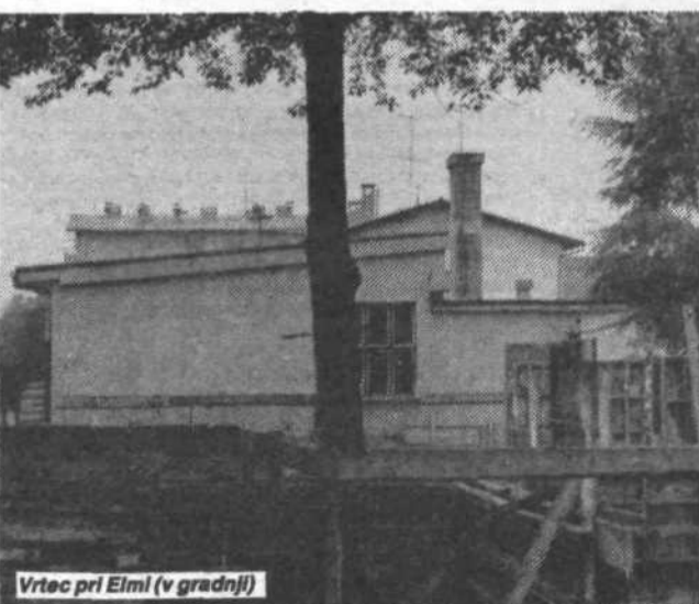
Vrtec pri Elmi (v gradnji)