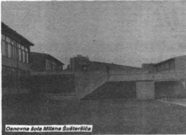
Osnovna šola Milana Šušteršiča

»Glasujem za, ker vem, za kaj glasujem!«