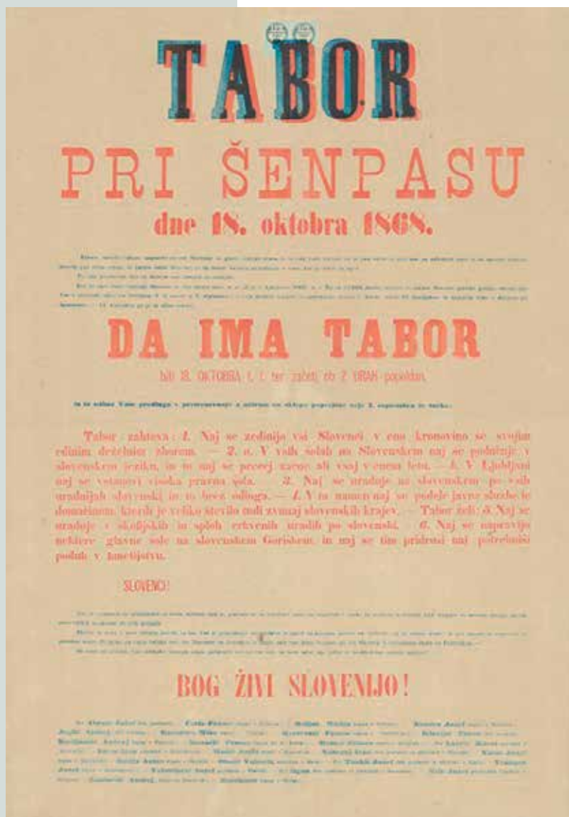
Plakat tabora v Šempasu dne 18. oktobra 1868.