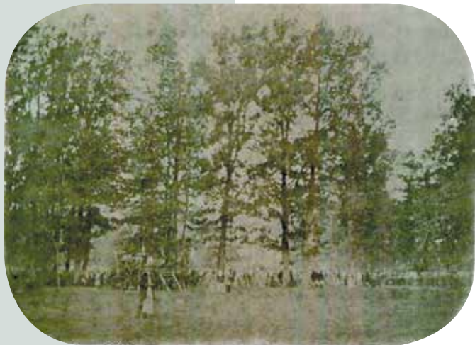
Prvi slovenski tabor v Ljutomeru dne 9. avgusta 1868.