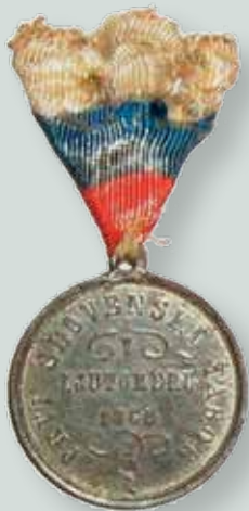
Spominska značka prvega slovenskega tabora v Ljutomeru (prednja stran), 1868. Hranijo jo potomci organizatorja in taborita iz Ljutomera.