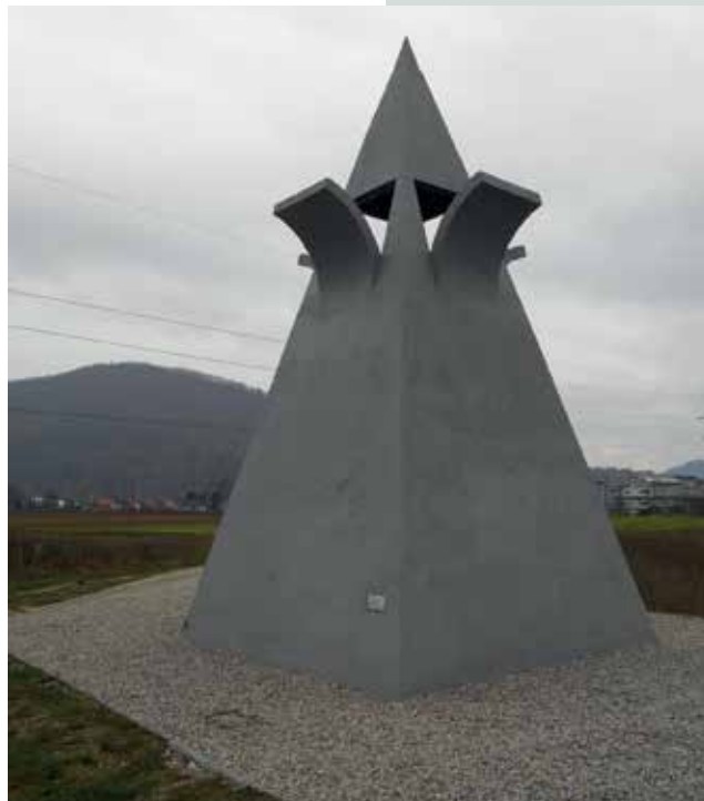
Spomenik taboru v Vižmarjih.

Kranjski tabori so bili organizirani, z izjemo Vižmarij, na Notranjskem, in sicer v Cerknici, kar dva pa v isti upravni enoti, v postojnskem okrajnem glavarstvu: na Kalcu in v Vipavi. Pri taborih na Kranjskem, razen v Vižmarjih, ni nepomembno, da je bil okrajni