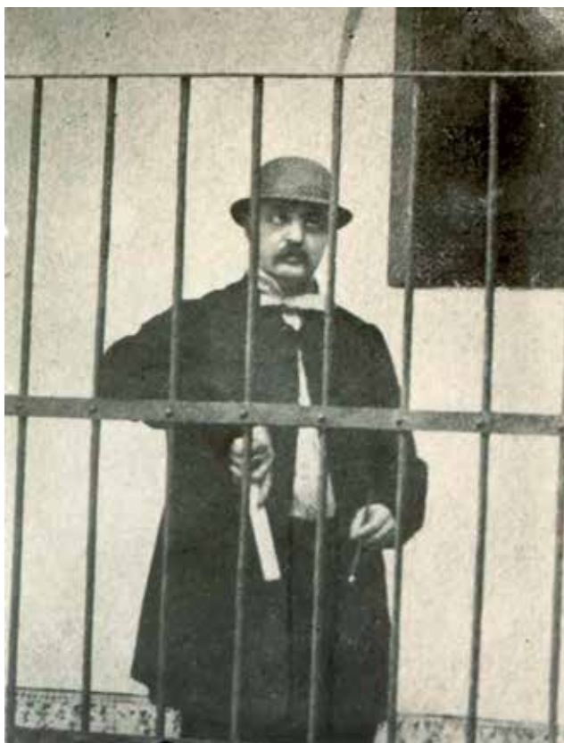
Miroslav Vilhar (1818–1871), slovenski pisatelj, skladatelj in politik, ki je organiziral tabor na Kalcu.

izhajali v Celovcu (nekaj let Einspielerjev Slovenec) in šele leta 1868 je na Štajerskem s finančno podporo Slovencev na Štajerskem začel izhajati časopis Slovenski narod. 14