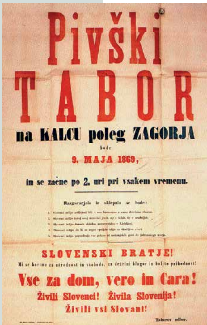
Plakat za pivški tabor na Kalcu poleg Zagorja z dne 9. maja 1869.