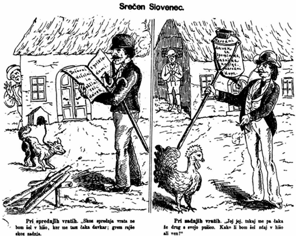
Srečen Slovenec, karikatura ponazarja davčne obveznosti.

Vsaj bogatejši kmetje so pogosteje odhajali na volitve. Zaradi volilne pravice je velik pomen dobila politična propaganda in še bolj kot prej so spodbujali branje časopisov. Zaradi vedno večjega števila šol se je večalo tudi število pismenih, vsaj bralna pismenost odraslih, četudi se je stopnja pismenosti prebivalcev občutno povečala šele na prelomu v 20. stoletje, ko je bilo v posameznih okrajih pismenih že več kot 50 % prebivalcev. Obvezno obiskovanje šole, ki so ga zahtevali že od leta 1774 za vse otroke, se več desetletij ni dosledno izvrševalo, saj je primanjkovalo šol in učiteljev. Po slabih stotih letih, sredi 19. stoletja, pa je šola vendarle vedno bolj postajala obveznost vseh deklic in dečkov. S spremenjenim obdavčevanjem po letu 1848 je velika bremena gradnje šol, ki so padla na dežele, prevzelo podeželsko prebivalstvo. Treba je sicer dodati, da so kar nekaj šol zgradili tudi z donacijami bogatih posameznikov. Nekateri slovenski zgodovinarji menijo, da so tabori ljudi ozavestili glede odnosa do slovenskega jezika. V samo devetih letih (1862–1871) je število članov Mohorjeve družbe zrastle s 1.620 na 17.395.