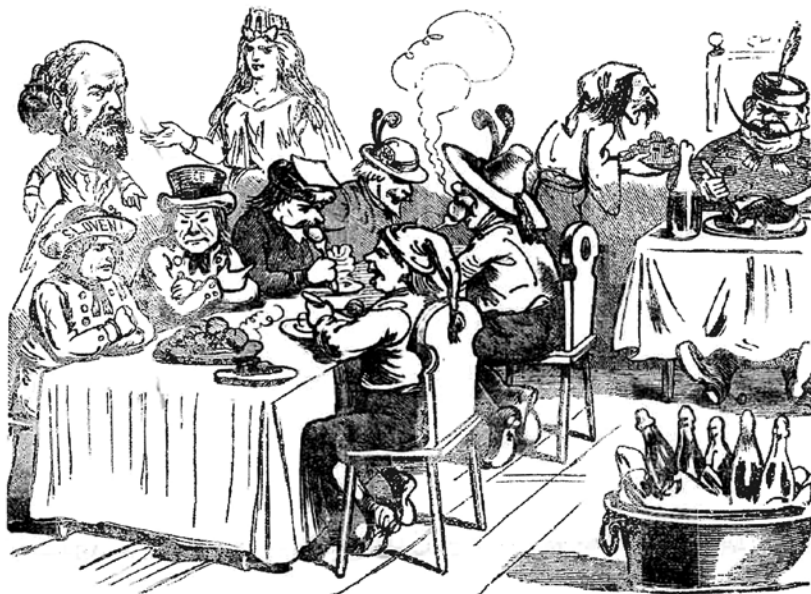
Slovana. Krčmarica, zdaj bi že bilo enkrat čas, da bi tudi midva kaj dobila. Drug bo do kmalu že vsi siti.

Karikatura ponazarja odnos oblasti do narodnih zahtev Slovencev in Slovanov habsburške monarhije sploh.