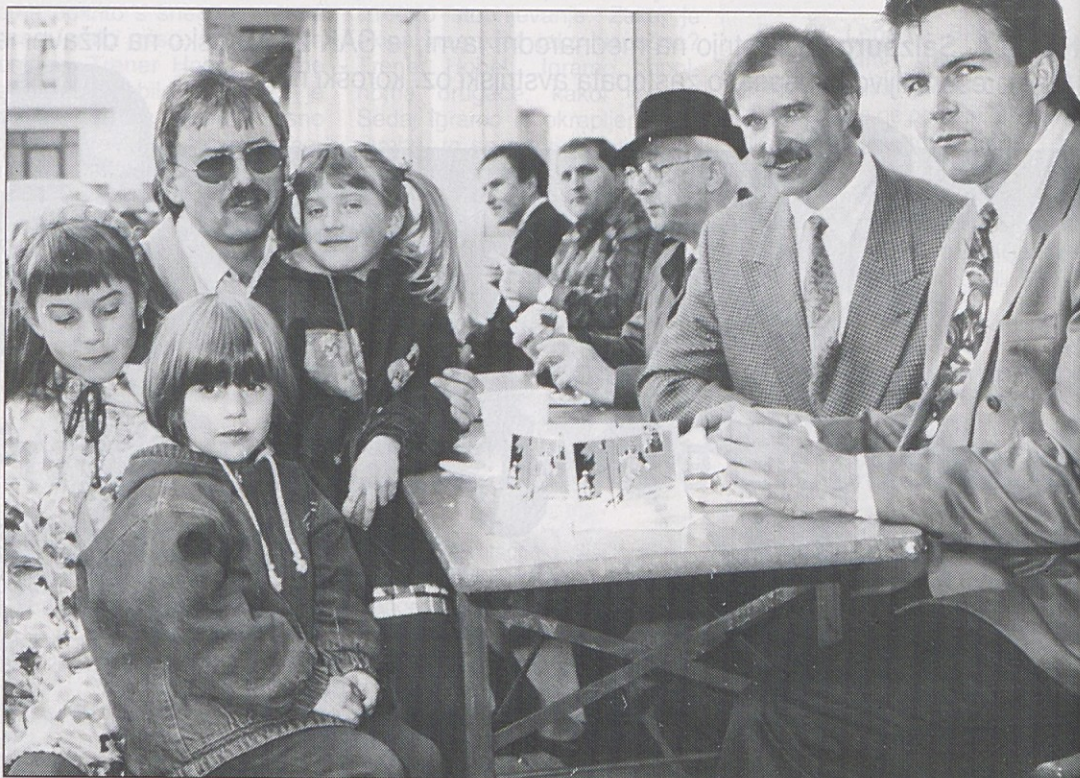
Pri mladih obiskovalcih je bil v ospredju svetovno znani smučar Armin Bittner iz Nemčije, katerega obisk posredovala tovarna ELAN. Toda tudi starejši so želeli njegov podpis (avtogram).