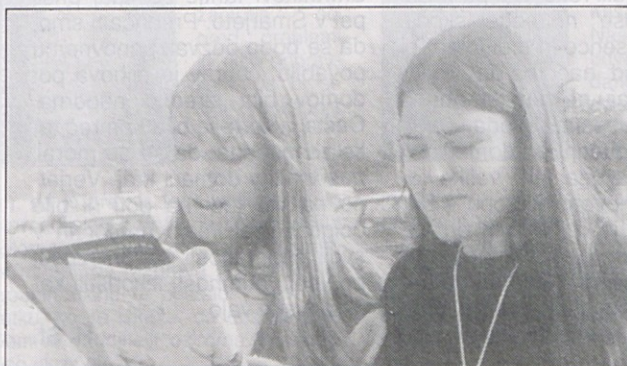
Dijaki Slovenske gimnazije so v Mariboru hitro našli nove prijatelje.

tos zastopane tri gimnazije; dve iz Gradca in Slovenska gimnazija iz Celovca. Časovno zelo natrpan, a hkrati pester spored je nudil vsakomur kaj: od mnogih gledaliških predstav in plesnih teatrov preko koncertov klasike in rocka do likovnih razstav. Kljub temu bi organizatorji lahko sestavili boljše zaporedje predstav. Skakanje z ene gimnazije na drugo je bilo zelo naporno; temu bi se izognili z boljšo časovno, pa tudi krajevno koordinacijo terminov.