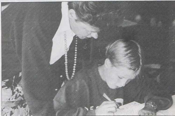
Strokovni učitelji zagotavljajo kar največji uspeh.

– tri ure pouka dnevno (razen v sobotah in nedeljah)