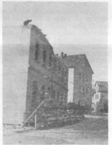
Tudi tale stara stavba na Pokopališki se bo morala umakniti nezprosni urbanizaciji Most