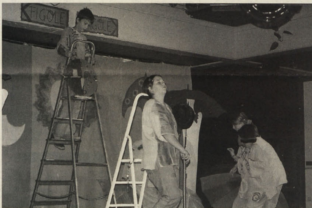
Ko stražmojster spi, se pa marsikaj zgodi ...