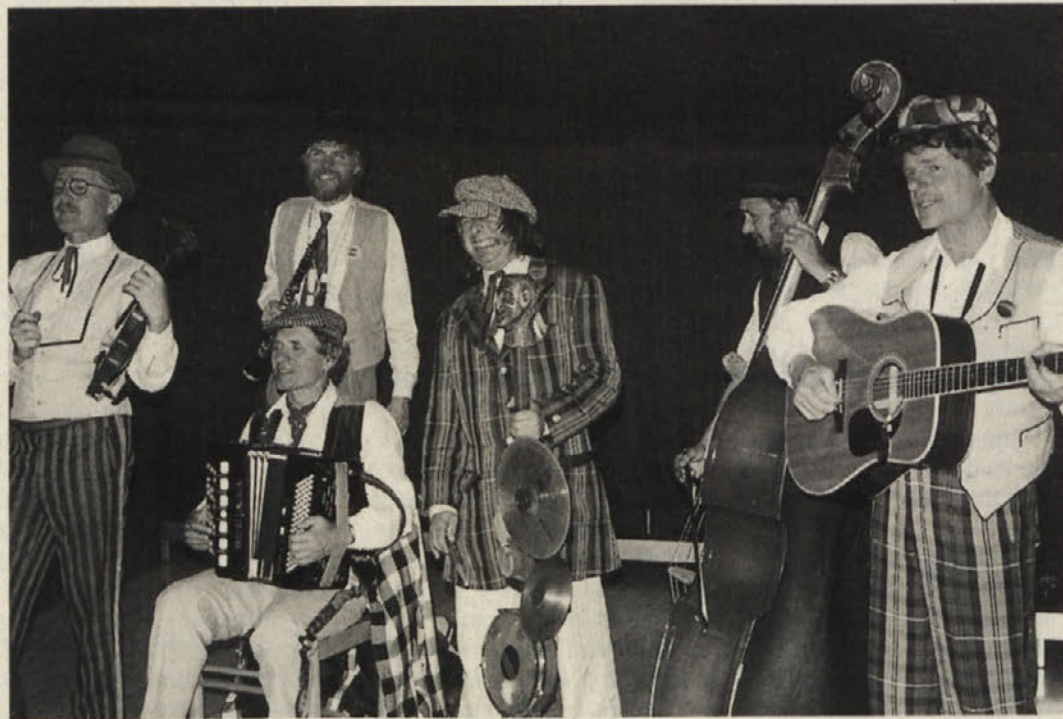
Pražska klamovka ni samo glasbeni ansambel, pač pa so njeni člani tudi mojstri humorja