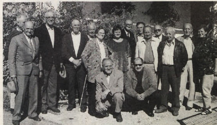
Člani upravnega in nadzornega odbora Zveze koroških partizanov.

P RETEKLO soboto sta se pri Lajčaharju v Kotmari vasi sestala upravni in nadzorni odbor Zveze koroških partizanov in prijatelj protifašističnega odpora.