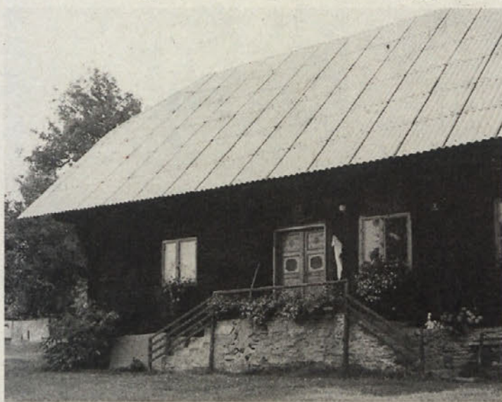
Idilčna in okusno obnovljena kmečka hiša Sekolovnikov