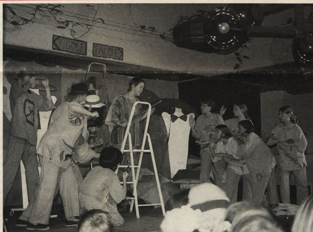
Gledališke premiere na Koroškem se vrstijo druga za drugo. Prva od dveh gledaliških skupin v Bilčovsu se je že predstavila z igro »Figole Fagole«; na sliki pa je prizor iz uprizoritve

Zrelost, odprtost in struktura lokalnih političnih faktorjev je še vedno odločilna in odločujoča za sožitje na južnem Koroškem. Politična težnja naslednjega leta bodo prav gotovo v znamenju zahtev po dvojezičnosti.