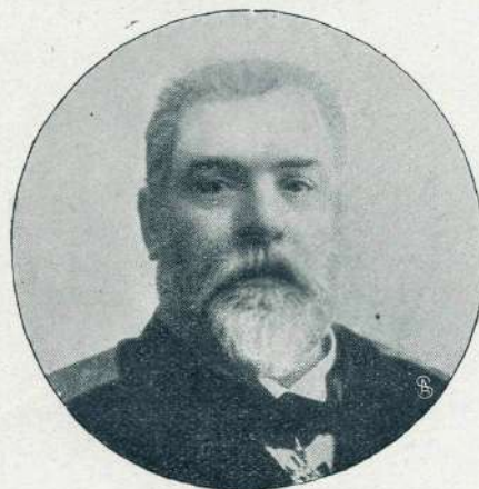
Admiral Nebogatov, poveljnik tretjega ruskega tihomorskega brodogva.