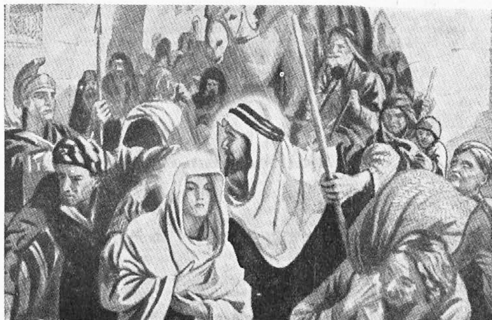
Na poti v Betlehem

Če bi jaz ali ti pozno na večer v tujem kraju od vrat do vrat prosila za prenočišče — in bi se vsaka vrata pred menoj zaprla — do zadnjih vrat, . . . in bi morala ne v kolodvorsko čakalnico, temveč ven v noč. — in to pozimi in v takih okoliščinah?