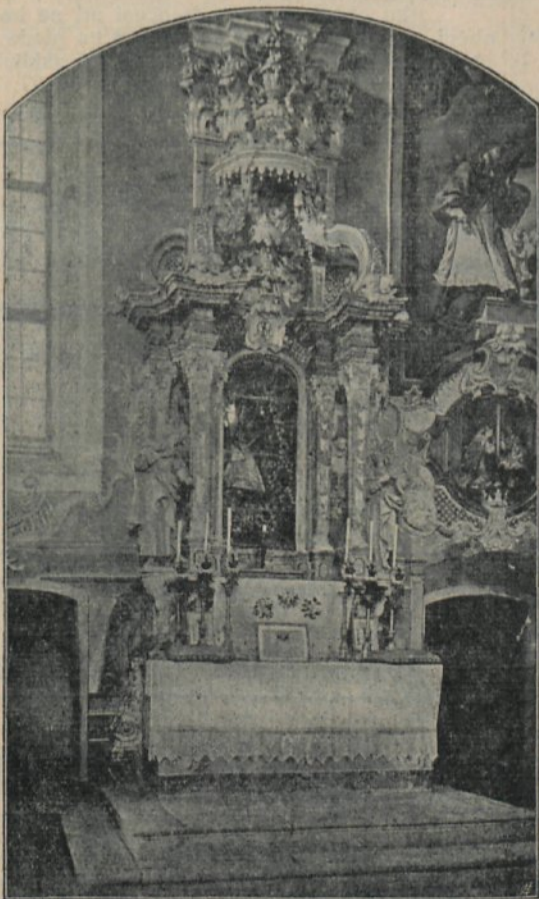
Oltar župne cerkve v Smarju

no sodnijo v Cerovcu, je podrejenih 13 davčnih občin s 4560 dušami.