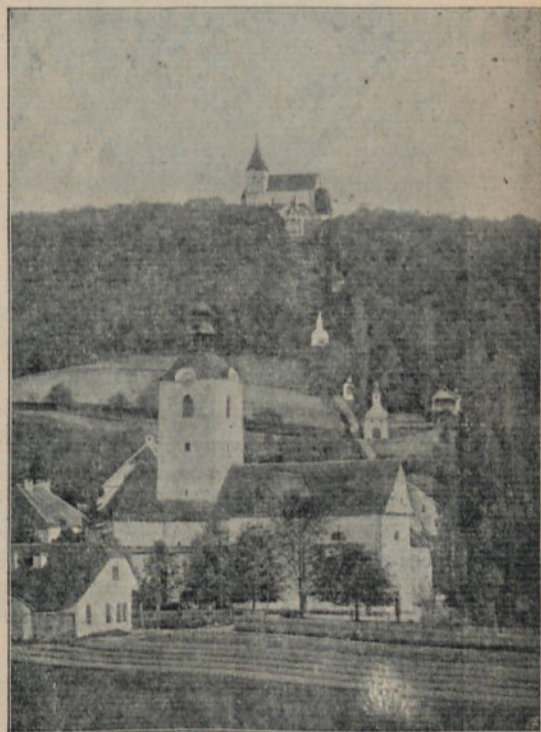
Cerkev sv. Roka