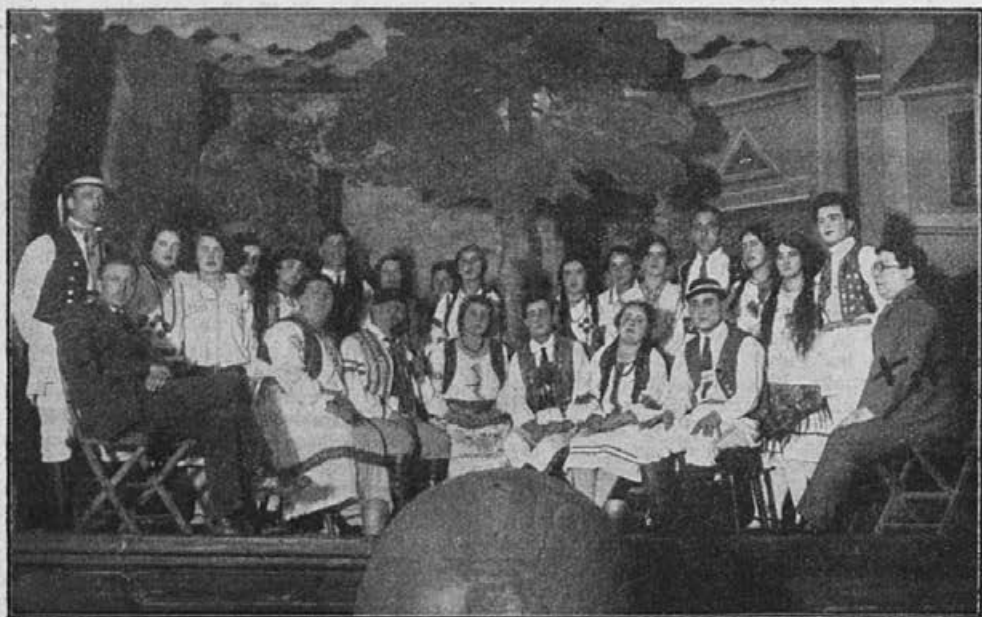
„Smiljana“ v izvedbi jeseniškega pevskega zbora.

ritma v glasbi, posebno v nar. glasbi eno najvažnejših vprašanj. Zato se Pevska zveza ni ustrašila stroškov, da postavi s to knjigo temelj in otvori znanstveno (kritično) delo o naši nar. pesmi; kajti to bo prvo delo te vrste, ki bo gotovo nudilo bogato snov vsem našim produktivnim skladateljem in vsem onim, ki se pečajo s folkloristiko. V smislu odborovega sklepa bomo poslali knjigo, ki bo dotiskana do srede avgusta, vsem naročnikom »Pevca« po 20 Din izvod, če naroče knjigo naprej in pošljejo denar Pevski zvezi do 1. septembra t. l. Kdor ni naročnik »Pevca«, dobi knjigo za 30 Din, če pošlje denar do 1. avgusta. V poznejši prodaji bo stala knjiga 50 Din, za naročnike »Pevca« nekaj ceneje. — Vabimo na naročbo vse cenjene naročnike in vse one neštete pevce, ki ljubijo našo nar. pesem in jo tako radi pojo. Knjiga jim bo pokazala neštete pesmi šele v pravi meri in v pravem okviru. Razprava bo odkrila izredne zanimivosti naše pesmi, zato si jo bo gotovo naročila večina že pred prvim avgustom.