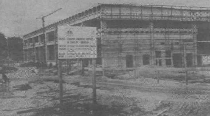
Nova Gradisova tovarna gradbene opreme in strojev v industrijski coni MP-3 v Mostah bo gradbeno dokončana do 29. novembra letos. Potem bo treba še preseliti stroje s stare lokacije na Smartinski 23 in kupiti nekaj novih.

Obseg investicij so v Integralu letos znižali za polovico, tako da usmerjajo naložbe le še v nakup vozil, opreme in v razvojne programe.