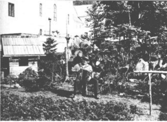
Za pravi, pravcati pravilčni gozd so poskrbell lovci