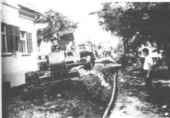
Dela pri sanaciji ceste proti Garantu