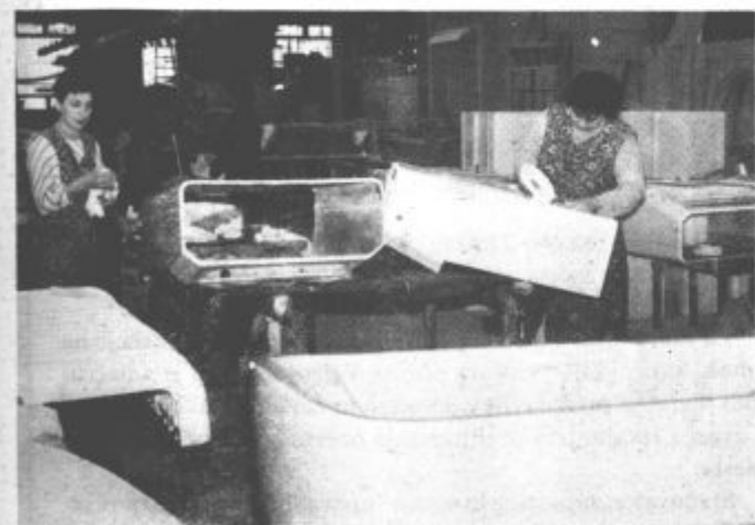
Očitno zdravi programi niso dovolj. Potrebna bo zvrhana mera enotnosti pri odpravljanju krize in veliko trdega dela za uspešno gospodarjenje