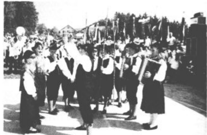
Prisrčen sprejem so jim pripravili mladi