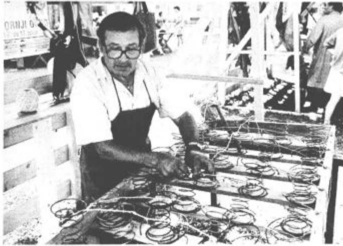
Raznolika je bila predstavitev nekdanjih opravil

dolini najboljša in zna se zgoditi, da bo ostala najboljša tudi po koncu sezone. Srebrni jubilej so v Gornjem Gradu dostojno obeležili. V devetih dneh krajevnega praznika so s številnimi športnimi, kulturnimi in narodopisnimi