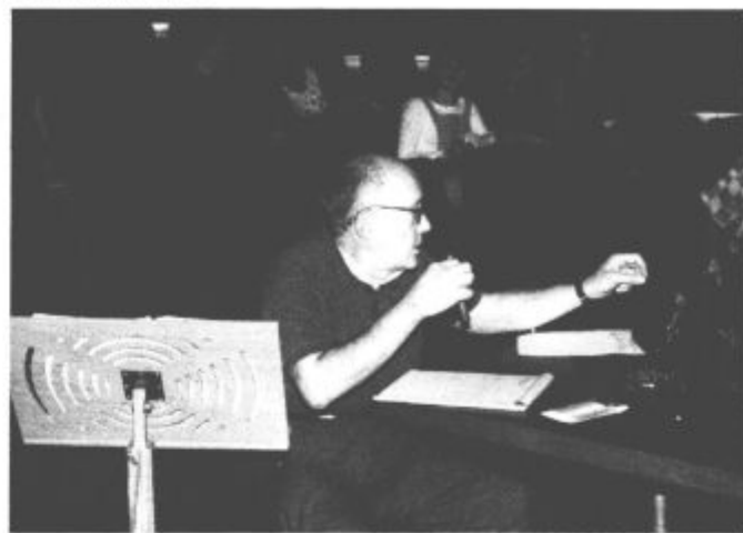
Profesorja Lateinerja so letos privabili odlični pogoji za delo in delstvo, da mu je bilo lani tu lepo. Udeležence šole pa najbrž želja po izpopolnjevanju klavirskega znanja

Dopoldanski čas namenijo teoriji, popoldanske ure igranju na klavirju. Kaj so se naučili, bodo udeleženci mednarodne klavirske šole pokazali občinstvu na zaključnem koncertu ob koncu šole. Ta bo jutri (v petek) v veliki dvorani glasbene šole Frana Koruna Koželjskega v Velenju. Začeli ga bodo ob 20. uri.