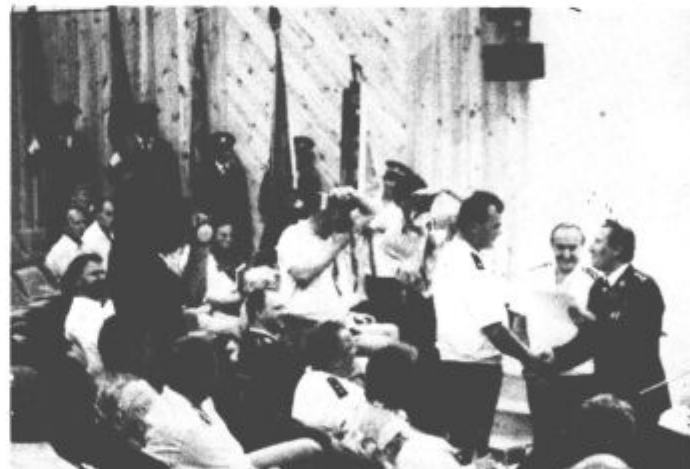
Vaja dela mojstra in tudi ta prikaz reševanja je bil namenjen čim večji usposobljenosti ob morebitni nesreči