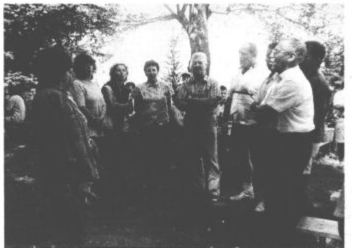
Lepo vreme so naročili, za ostalo poskrbell sami