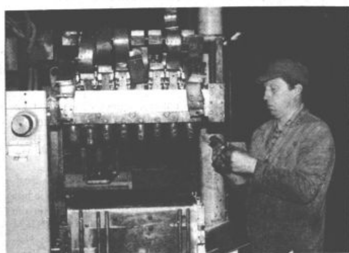
Redni pregled in preventivna vzdrževalna dela so vsekakor pomembna opravila zaposlenih v Gorenjevem Vzdrževanju