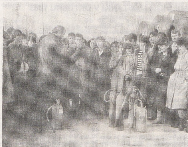
Delavci iz Bihaća so 1. decembra spoznali tudi osnove iz požarnega varstva, že naslednji dan pa so se seznanili z delovnimi nalogami v proizvodnih tozdih, kjer bodo znatno prispevali tudi k povečanju proizvodnje.

Prepričani smo, da bodo delavci, za katere je to tudi prva zaposlitev, našli v Gorenju pravo okolje, razumevanje ter pomoč naših delavcev. V Gorenju in Titovem Velenju želimo delavcem iz Bihaća kar najboljše počutje.