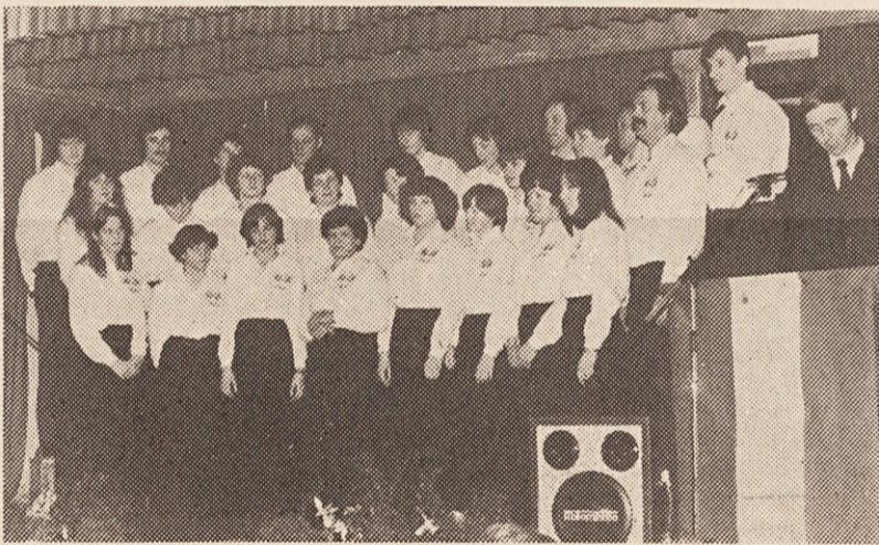
Kaj niso lepi v novih oblekah? Vsem, ki so jih podprli finančno, se društvo zahvaljuje