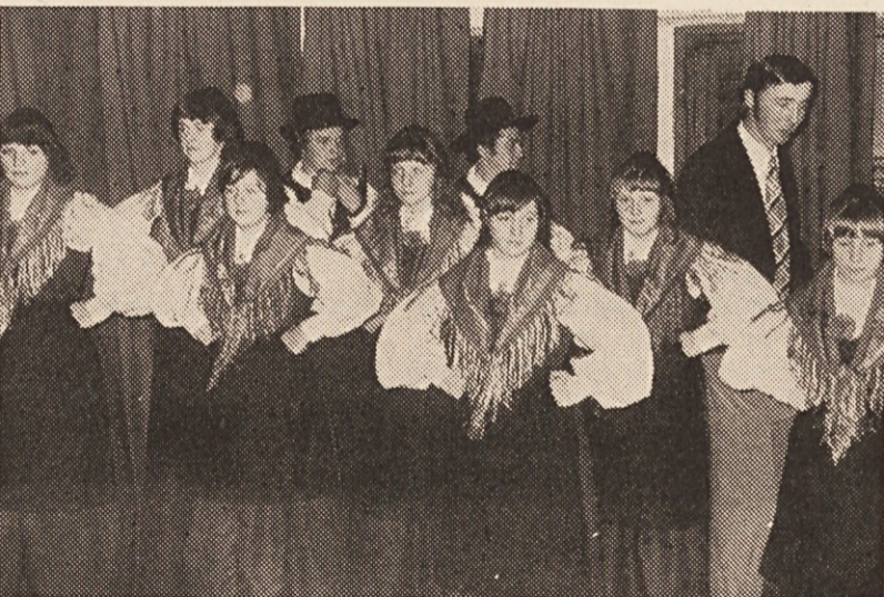
Folklorna skupina pri enem svojih nastopov