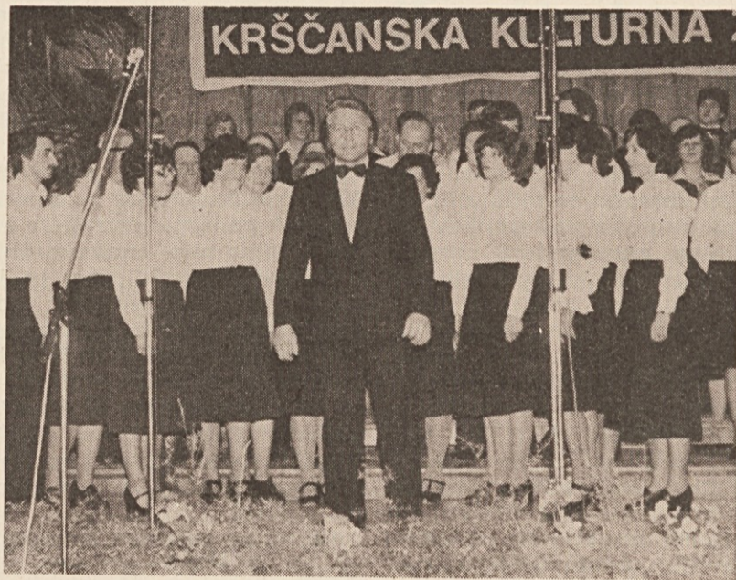
Čeprav je zbor še razmeroma mlad, je že nastopil na reviji „Koroška poje“