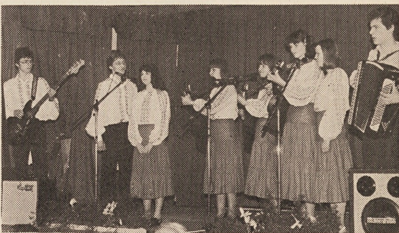
Kot gost nedeljske prireditve je nastopil ansambel Mladi mi — dijaki Slovenske gimnazije