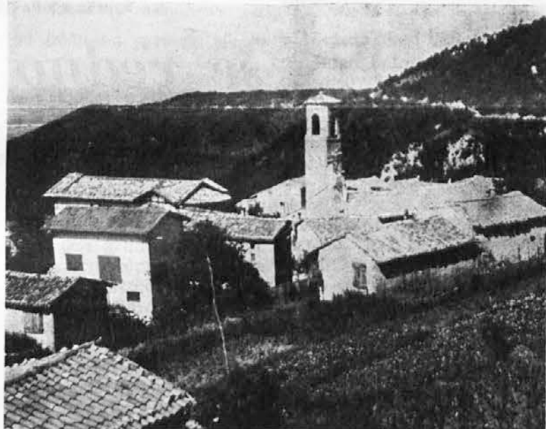
Čenebola je še danes, kljub velikemu izseljevanju v tujino in po Italiji, ena največjih slovenskih vasi v občini Fojda. Leži na zahodnem pobočju Ivanca, pod njo pa se odpira dolina hudournika Brega (Grivò). Ima lastno cerkev in je oddaljena od italijansko-jugoslovanske meje malo več kakor pol ure hoda

Veter je raznašal sneg po vasi in mraz je pritiskal. «Kakšna bo vožnja z avtomobilom po spolzki cesti nazaj v dolino», nas je skrbelo. Pomladi, ko češnje cveto in bo nebo jasno, pa spet na svidenje v Čeneboli!