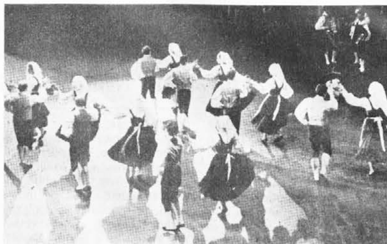
Znana folklorna skupina "Chino Ermacora" iz Cente je osvojila srca naših emigrantov, ki živijo v Luksemburgu

Na povratku s folklornega festivala narodov, ki se je letos vršil v Bremnu (Nemčija) od 29. januarja do 2.