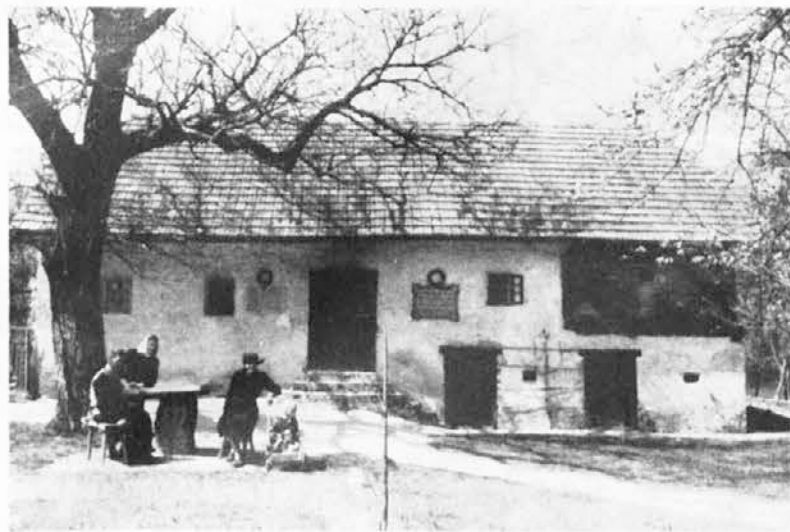
Rojstna hiša Josipa Jurčiča na Muljavi na Dolenjskem

Danes pa živi Muljava izključno v senci Jurčičevega imena, od njegove rojstne hiše, ki je spremenjena v muzej in lepo vzdrževana pa tja do gostilne pri Obrščaku, ki ima še sedaj ohranjeno Jurčičevo sobo, poslikano s freskami iz njegovih povesti in romanov.