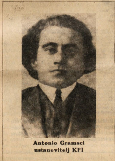
Antonio Gramsci ustanovitelj KPI

borci komunističnega gibanja na pravilnih marksistično-leninističnih osnovah. Razumeli so, da je treba boj slovenskega ljudstva za politične, gospodarske, družbene in narodne pravice vskladiti z vse- splošnim bojem italijanskega delavskega gibanja za spremembo razmer v Italiji in