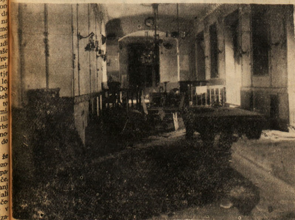
V Delavskem domu v Trstu je bil tudi sedež osrednjih kulturnih organizacij, med drugim tudi »Ljudskega odra«, ki je bil v letih pred nastopom fašizma, pravo kulturno središče tržaških slovenskih delavcev. »Ljudski oder« je imel tudi bogato knjižnico. Da bi zadostil kulturnim potrebam delavcev, je razširil mrežo svojih podružnic po vsej Primorski. Na gornji sliki: pogled na opustošeno dvorano po fašističnem napadu.

Medtem je prišla policija, vdrla v poslopje in aretirala vse, ki so bili v njem, jih uklenila kot največje zločince, mnoge izmed njih tudi pretepla in nato odpeljala v zapor. In tedaj se je začelo fatalno vandalsko početje. Podivjana drhal pomešana s policisti je začela razbijati stroje in kmalu zatem so se pojavili plameni, ki so dokončali uničenje.