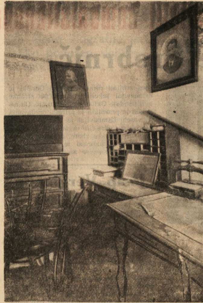
Zloglasni Giuntovi škvadrsti so večkrat navalili na Delavski dom v Trstu in so ga končno, zaščiteni od tistih, ki bi morali biti čuvarji javnega reda, popolnoma opustošili. Gornja slika je bila posneta po enem izmed napadov

(Priučoči sestavek smo sestavili na osnovi članka o 1. kongresu, ki je bil objavljen v »Delu« dne 11. maja 1921.)