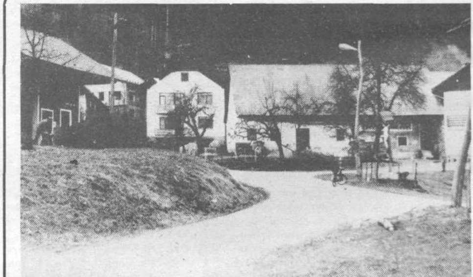
Podolnška panorama: staro se meša z novim