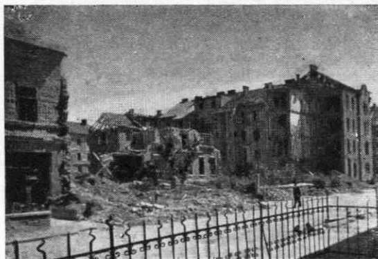
Sl. 1. Maribor. Očiščene ruševine v letih 1944/45 bombardiranih hiš v Ulici kneza Koclja št. 25 in 25

Slike naj bodo vsekakor zložene po letih nastanka poslopij in gradbenih sprememb, ker le tako bo viden kronološki gradbeni razvoj posameznega kraja. Iz tega razloga je primernejša foto-kartoteka, v katero prav lahko vložimo slučajno dobljeno sliko iz starejše dobe. Da pa ne bo n.pr. zaradi reprodukcije treba uporabljati kartotečnega lista, pri čemer je v tiskarni slika izpostavljena vsaj poškodbi, če ne že izgubi, mora poleg zbirke slik obstajati še zbirka predmetnih foto-negativov, da je vsak čas mogoča izdelava nadaljnjih slik. Ali pa mora biti znan avtor slike, da se pri njem naročijo nadaljnje slike.