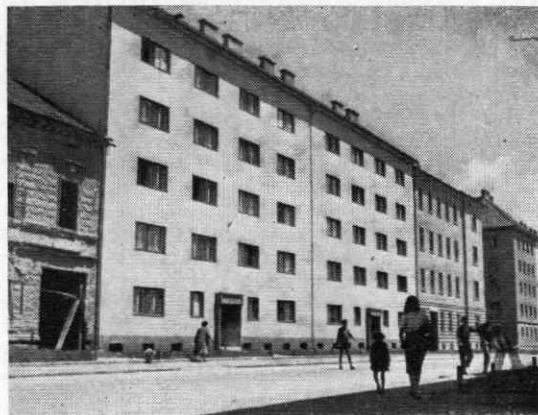
Sl. 2. Maribor. Na prostoru porušenih hiš novo zgrajeni hiši v Ulici kneza Koclja št. 23 in 25 ter obnovljena hiša št. 27