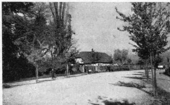
Sl. 3. Hiša na Gosposvetski cesti št. 31 v Mariboru, ki je bila porušena septembra 1953 zaradi predvidenega podaljška Gosposvetske ceste od odcepa Vrbanke ceste proti zahodu. Hiša je bila zadnja lesna — ometana stavba iz dobe starega Maribora, ki je imela v stropniku vrezano letnico 1695. Čez leto dni bo na tem mestu vidna v osi ceste 7-nadstropna stanovanjska hiša in urejena nova cesta

Da pri obsežnejši zbirki ne bo zamudnega iskanja slik, naj bo zbirki slik in negativov priložen tudi alfabetični seznam zgradb z letnico nastanka in številko negativa ali imenom avtorja. Seveda je treba marsikatero sliko vpisati na več mestih, n. pr.: staro mesto, šola, bolnica (pozneje v isti zgradbi), rušenje zaradi regulacije ulice in podobno. Le tako se bo mogoče izogniti prepogostemu prelaganju kartoteke in s tem seveda postopnemu poškodovanju slik. Urejevalec zbirke bo odločil ali vložiti sliko nove zgradbe samo pri letu njenega nastanka ali morda priloži sliko predhodnega stanja poleg nove in morda vmes še kako zanimivo razdobje (N. pr. stare hiše — novo šolo na istem mestu — ruševine po bombardiranju — začasen javni nasad na prostoru po odstranitvi ruševin in končno morda še novo zgradbo na istem prostoru). V seznamu pa mora biti slika vpisana za vsak primer posebej in morda še označena povezuje z drugimi slikami, če niso te vse nalepljene na enem kartonu.