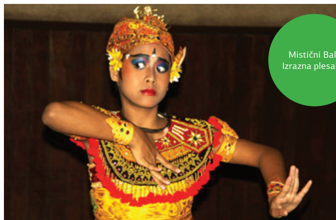
Mistični Bali: Izrazna plesalka