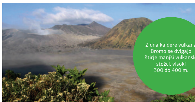
Z dna kaldere vulkana Bromo se dvigajo štirje manjši vulkanski stožci, visoki 300 do 400 m.