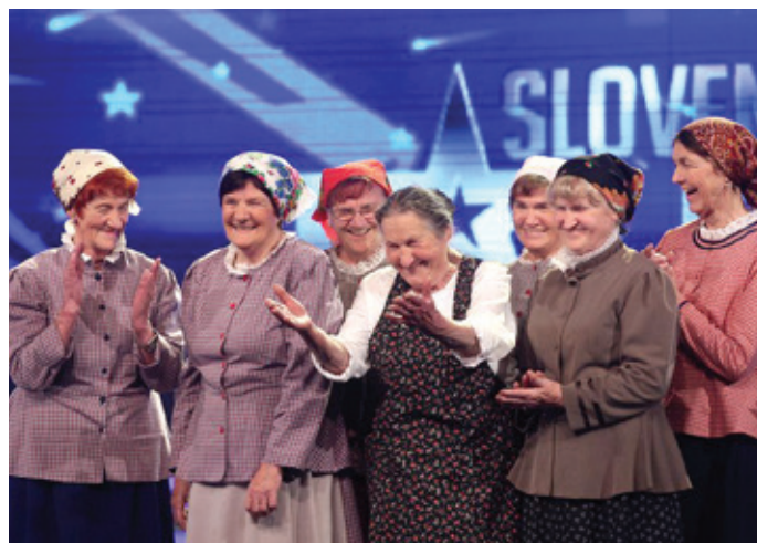
Slovenija ima talent