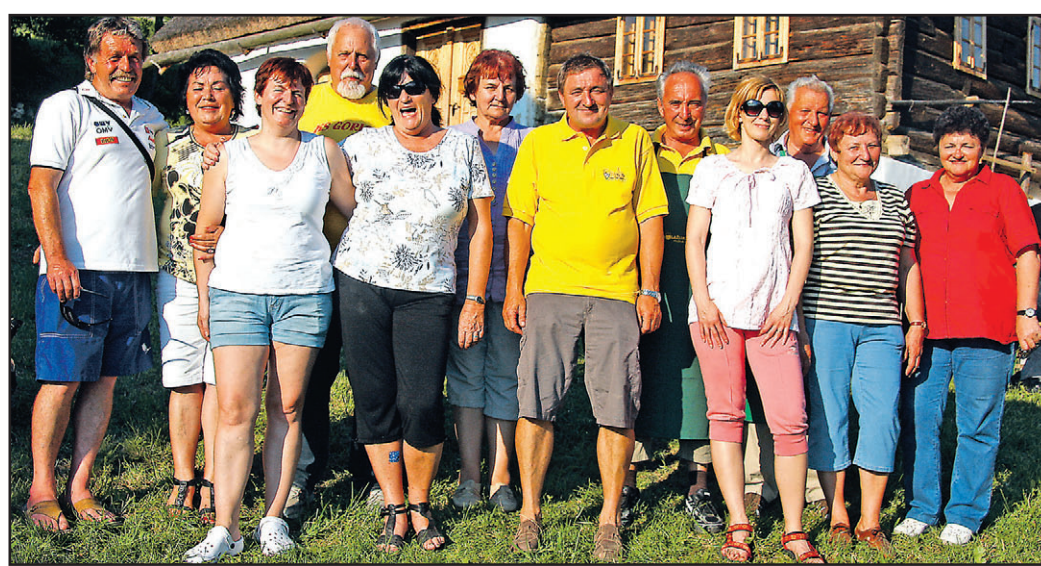
Na Grilovi domačiji so v petek uživali otroci, v nedeljo pa vse generacije.

stične ponudbe Velenja, v razpravi pa so govorili predvsem o hudem pomanjkanju sredstev za delovanje turističnih društev. Franc Špegel