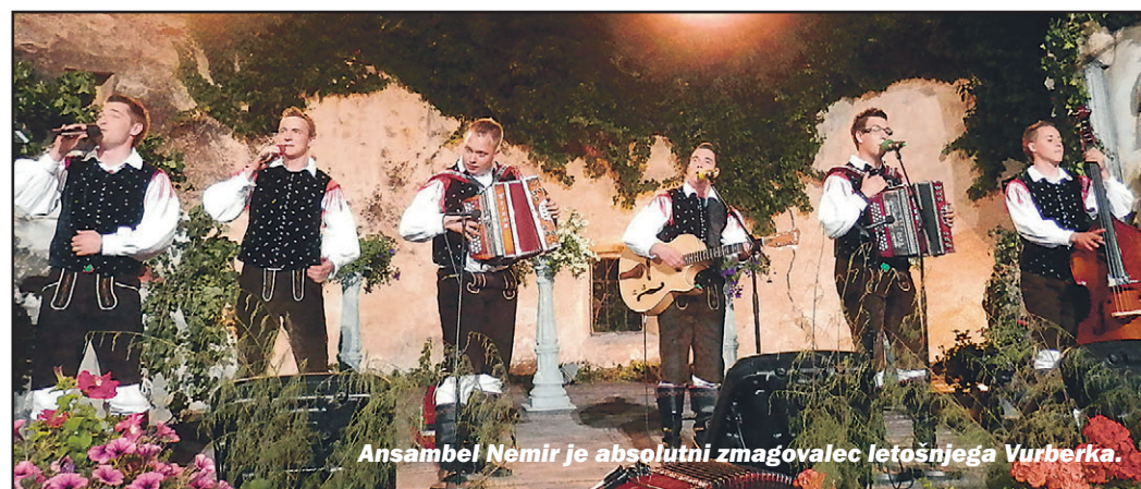
Ansambel Nemir je absolutni zmagovalec letošnjega Vurberka.

Vurberk, 16. junija - Na 21. festivala slovenske narodnozabavne glasbe na Vurberku je štirinajst nastopajočih ansamblov izvedlo po dve pesmi, valček in polko; tokrat žal (izjemoma) ni bilo med njimi nobenega iz Šaleške doline.