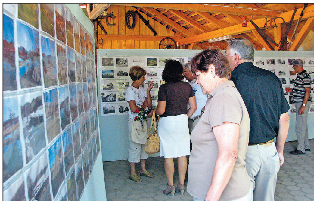
Razstava je bila zanimiva tako tistim, ki se izgubljenih krajev še dobro spominjo, kot tistim, ki se jih ne.