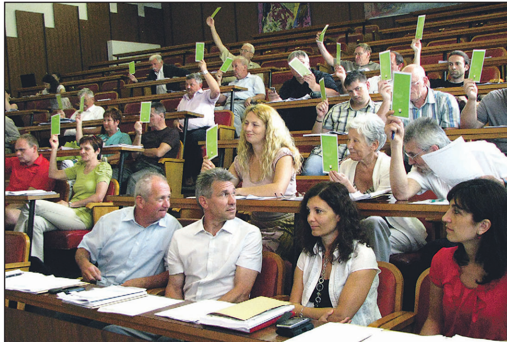
Je tukaj slučajno kdo proti? Ni videti.