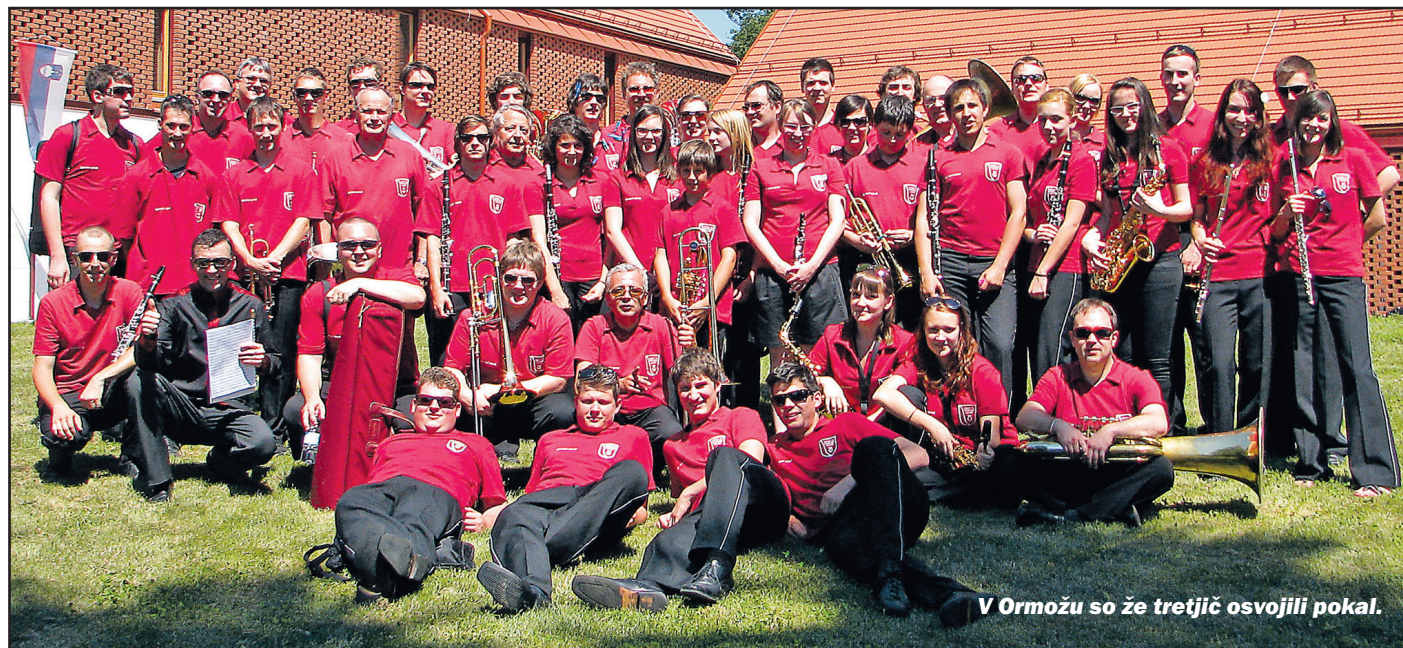
V Ormožu so že tretjič osvojili pokal.

Ormož, 16. junija - V Ormožu je bilo konec tedna 17. tekmovanje slovenskih godb v zabavnem programu za pokal Vinka Štrucla, vsestranskega slovenskega glasbenega ustvarjalca.