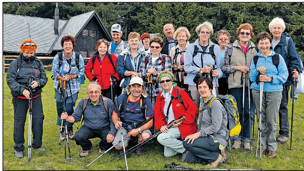
Planinska družina pred kočjo na Travniku.