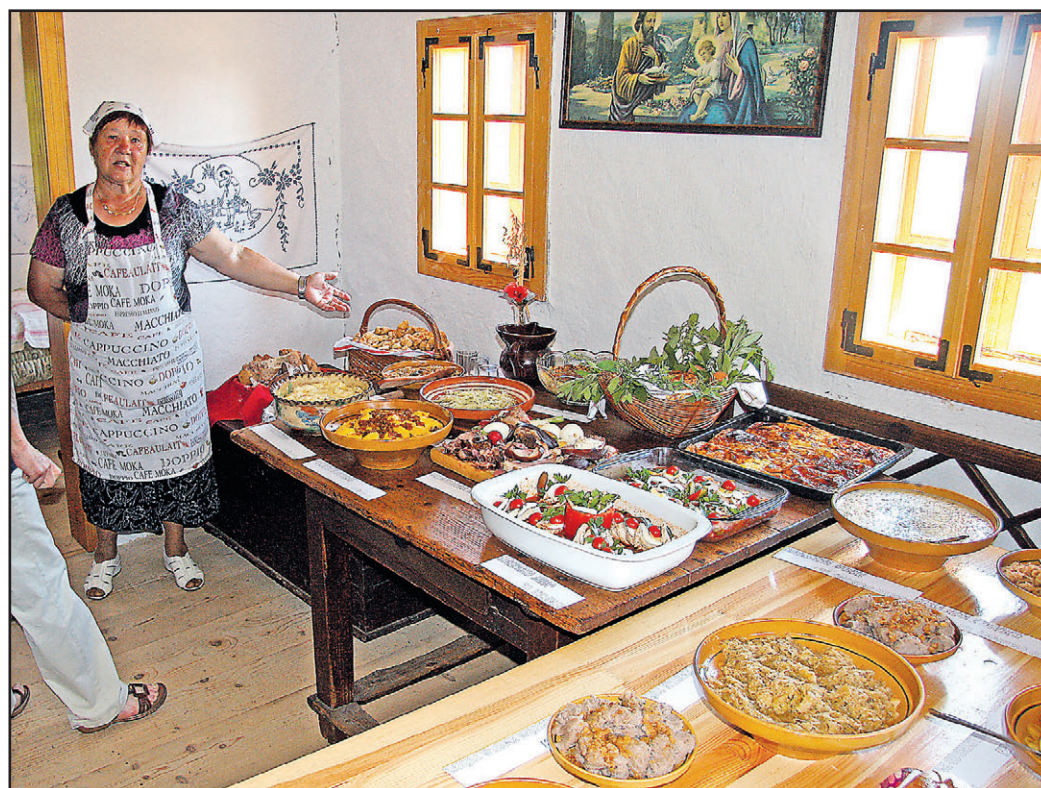
Med turističnim tednom je bila na Grilovi domačiji zanimiva razstava starih slovenskih jedi. Jedila so lahko udeleženci prireditve tudi poskusili. Pri starejših je bilo nekaj nostalgije, mlajši pa so bili presenečeni nad jedmi, ki jih doslej še niso poznali.

V ponedeljek popoldne so v Vili Bianca pripravili še okroglo mizo mladi v turizmu, v sredo dopoldne pa so tam gostili člane predsedstva in izvršilnega odbora Turistične zveze Slovenije. Njihov obisk so izkoristili tudi za predstavitev turi-