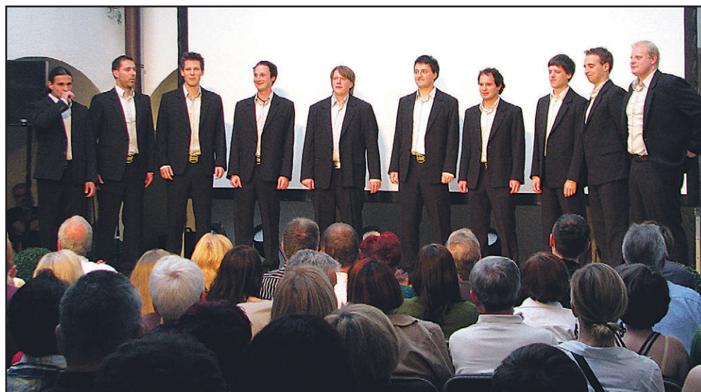
Šaleški študentski oktet je ob koncu tedna kar dvakrat napolnil atrij Velenjskega gradu.

Ob delavniku prejšnji teden je bilo zelo, zelo lepo, mirno, toplo, občutil si samost in hkrati bližino. Bilo pa je tudi tako, da sem intenzivno doživljal dolge trenutke, začutil živost, pa videl lepega srnjaka na poti domov in od Brložnika proti Belim Vodam kot po navadi poslušal Thunderstruck avstralskih AC/DC. Zelo naglas. Bilo je čarobno, kot mnogokrat, a spet zelo, zelo drugače.