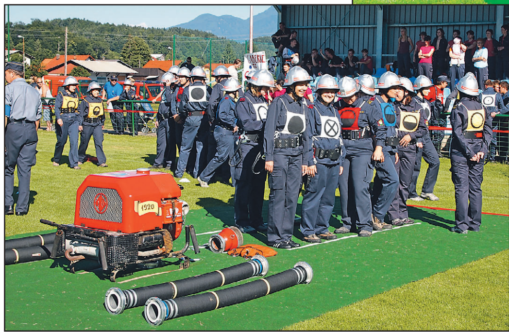
Zelo resno so tekmovanje vzeli tudi člani, članice, veterani in veteranke. Še vročina jim ni mogla do živčevja, tako spretni in hitri so bili.