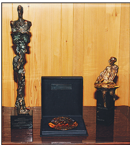
Jutri zvečer bodo na Akademiji poetična Slovenija v atriju velenjskega gradu podelili mednarodno Pretnarjevo nagrado in niz drugih nagrad. Kipci so že pripravljani.

Velenje, 20. junija – Včeraj se je začel Mednarodni Lirikonfest, ki ga že desetletje pripravljata Velenjska knjižna fundacija in književna asociacija Velenika. V partnerskem programu Evropske prestolnice kulture 2012 bo v osrednjem programu Lirikonfesta 2012 v Velenju devetih podeljena mednarodna Pretnarjeva nagrada za posredovanje slovenske književnosti in jezika drugim narodom. Uradna podelitev bo jutri ob 19. uri v atriju Velenjskega gradu. Na Akademiji poetična Slovenije bodo sedmič zapovrstjo podelili tudi nagrado čaša nesmrtnosti - velenjica za desetletni vrhunski pesniški opus slovenskega pesnika/-ce, šestič pa priznanje lirikonov zlat za vrhunske revijalne prevode poezije XXI. sto-