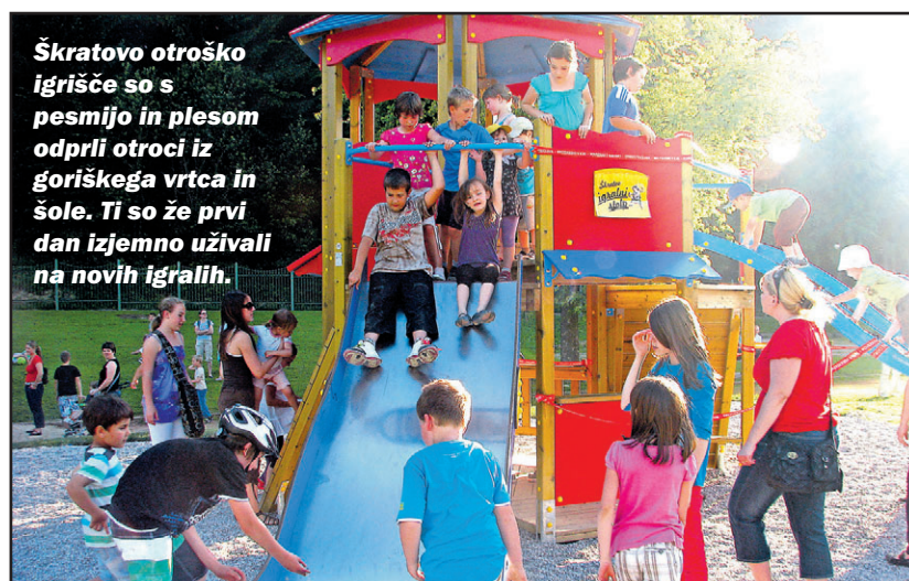
Škratovo otroško igrišče so s pesmijo in plesom odprli otroci iz goriškega vrtca in šole. Ti so že prvi dan izjemno uživali na novih igralih.

da so otroška igrišča dobro opremljena s kvalitetnimi igrali, ki spodbujajo razvoj otrokovih sposobnosti, predvsem pa, da so varna. Lokalne skupnosti za tovrstne investicije žal - še