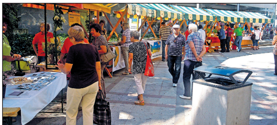
V soboto dopoldne so lahko obiskovalci centra mesta spoznali ponudbo kar 32 turističnih društev iz vse Slovenije.

stičnih društev (TD Vinska Gora, TD Velenje, TD Šmartno ob Paki, TD Šentilj, KS Gorica in nekaj gostincev), so bile tudi izjemno okusne. Obiskovalci prireditve so bili enotni, da je prireditev odlično uspela, saj je popestrila tudi prikaz življenja naših prednikov, ki ga prikazuje ta eko muzej na prostem. Ogedali pa so si lahko tudi zelišč-