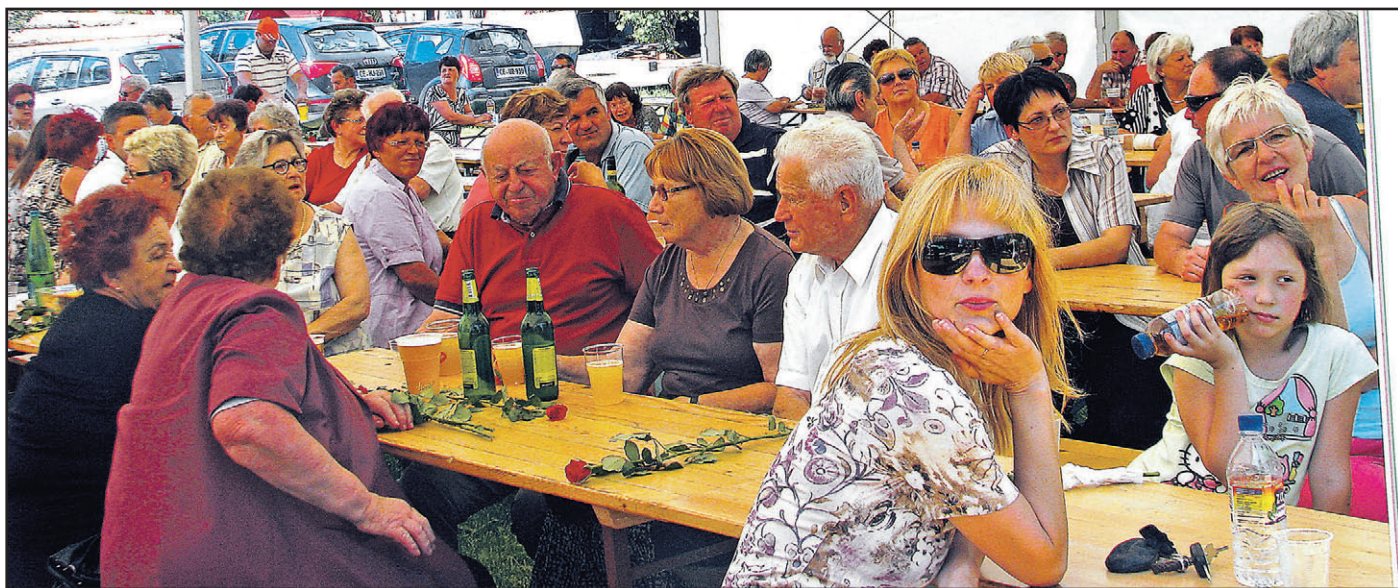
Šotor tokrat zbranih ni branil pred dežjem, ampak pred hudo vročino.