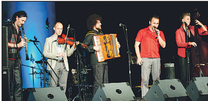
S skupino Jararaja je ob otvoritvi poletnih kulturnih prireditve rajalo veliko zadovoljnih ljubiteljev kulturnih dogodkov na prostem. In to je šele začetek...