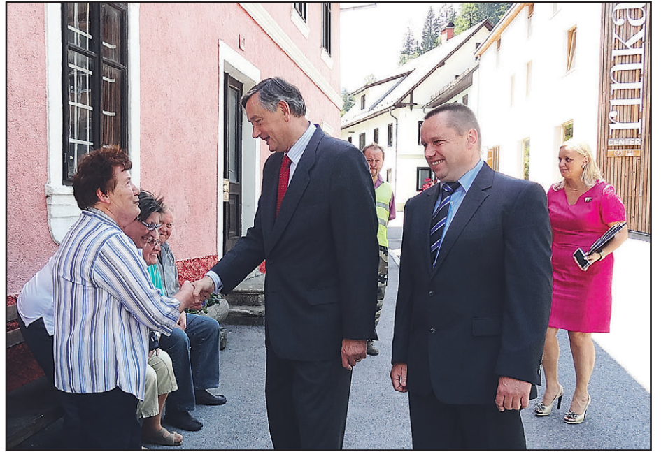
Predsednik države se je v Solčavi srečal tudi z nekaterimi krajinj

Predsednik je pozitivno ocenil tudi dosedanja razvoj čezmejnega sodelovanja, k čemur je pripomogla cesta čez Pavličovo sedlo in ureditev odnosov ob meji. Današnje povezave omogočajo povezanost med turizmom na avstrijskem Koroškem, ki je izredno razvit in tudi precej bolj množičen, z bolj butičnim, vendar visokokakovostnim