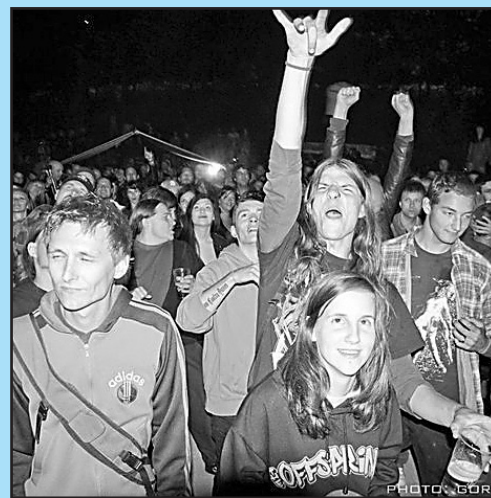
Koncerti v Letnem kinu so vedno pravo doživetje. Letos jih bo tam še več kot prejšnja leta.

Čeprav so vedno odvisni od vremena, bodo poskušali letos tam pripraviti še več dogodkov. Uvodni koncert pripravljajo že 7. julija ob 21. uri. Poimenovali so ga Poklon legendam, saj bodo gostili tri skupine, ki bodo igrale skladbe Nirvane, Guns' n' Roses in Queen. Kar nekaj koncertov bo tudi v času Kuniunde. Poleg tega bodo tudi letos pripravili festival nasledlega kita, dogovarjajo se za organizacijo poletnega campa za mlade v angleškem jeziku. Z društvom Venera pa bodo tam poleti pripravili tudi učilnico na prostem, ki naj bi bila že letos zelo aktivna.