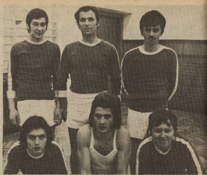
Zeleni so se v drugem polčasu razigrali, vendar naskok rumenih je bil le prehud