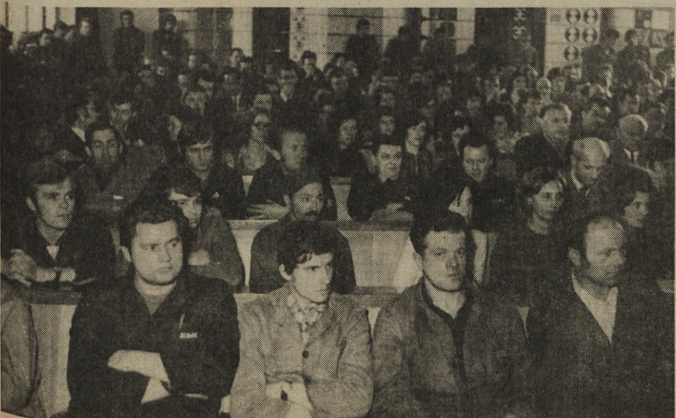
Na vseh razpravah o financiranju splošne in skupne porabe je bila dvorana DS zasedena do zadnjega kotička