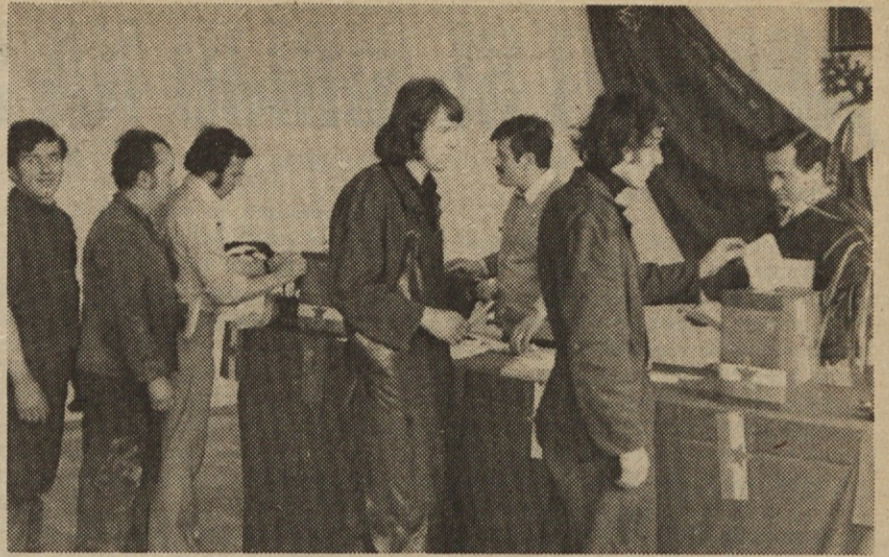
Z volišča v Iskri — EMO — TOZD tovarna kontejnerjev