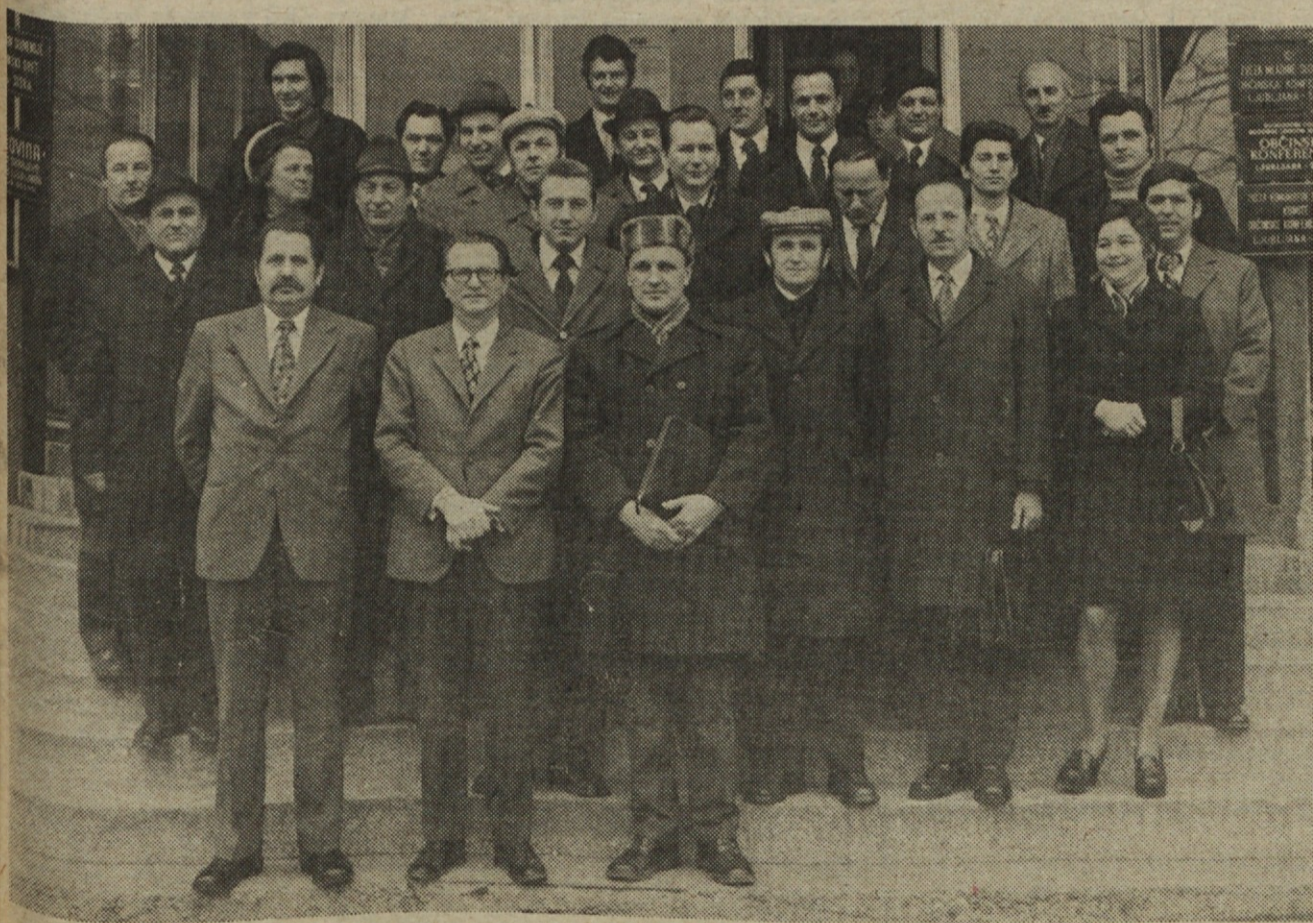
Spominski posnetek ob poteku mandatne dobe delavskega sveta ZP Iskra

Z zasedanjem skupščine preneha tudi mandat individualnim sedanjim vodilnim delavcem, zato bo skupščina odločala tudi o potrditvi mandata tem delavcem do izbora novih individualnih poslovodnih organov.