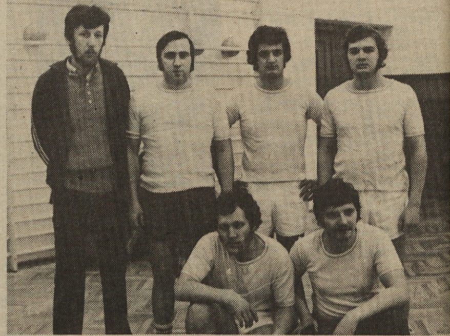
Zmagovalna – ekipa rumenih s sodnikom na levi