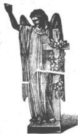
Brzojavi: Kamnoseška industrijska družba Celje.