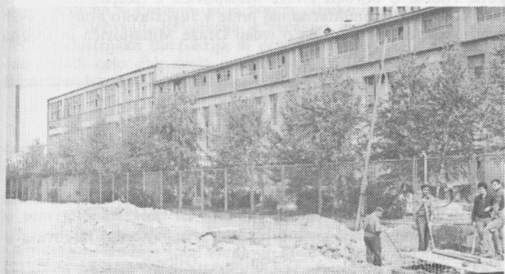
V starih prostorih je ostala usnjarna.