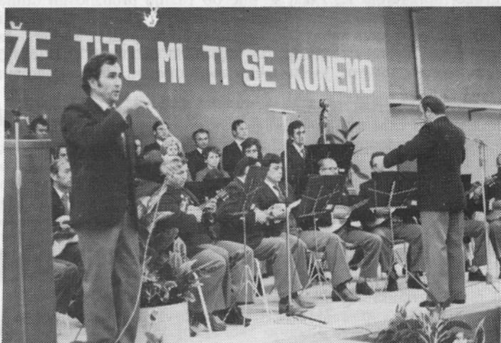
V kulturnem delu programa je sodeloval KUD PAVO MARKOVAC iz Bedekovčine