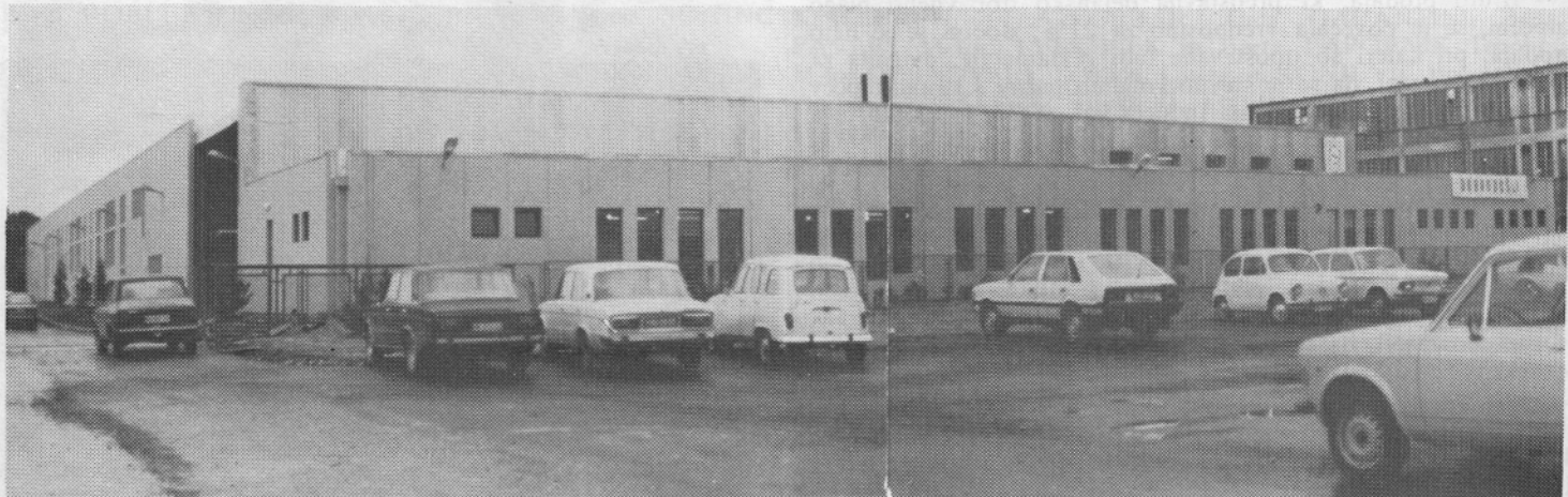
6 milijard 700 milijonov starih dinarjev je znašala investicija zgrajena v rekordnem času. Od takrat, ko so prvič zaropotali gradbeni stroji pa do otvoritve, je komaj nekaj več kot leto dni.