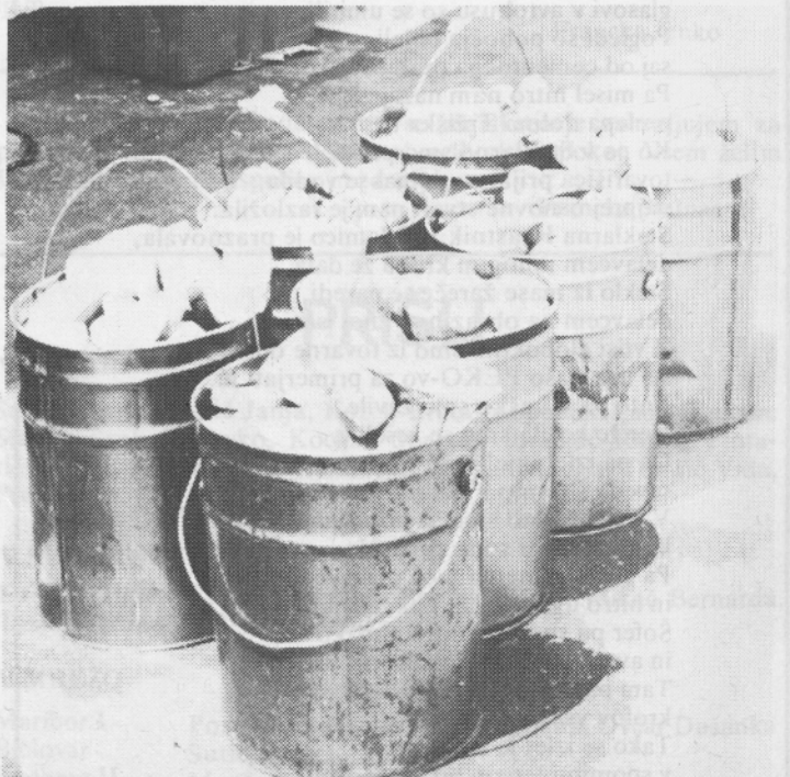
V svetu vsak dan umirajo ljudje zaradi lakote — mi pa tako »varčujemo«.

Kruh, ki ga nismo mogli pojesti za malico.