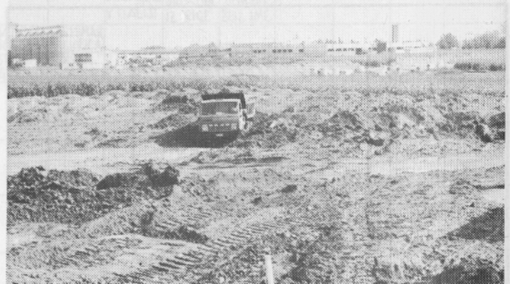
Gradbeni stroji so se zarili v zemljo, kjer bo stala nova proizvodna hala.

Celotna investicija znaša 97.760.000 din, od katere odpade na osnovna sredstva 85.637.000 din.