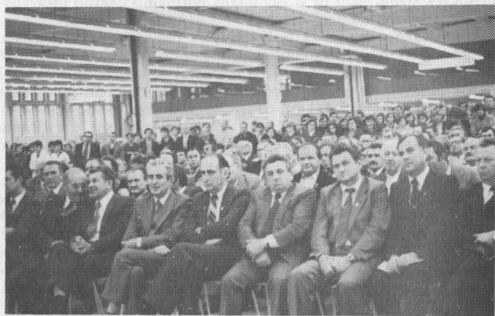
Zbrani gostje na otvoritvi.

Partizan je stara tovarna. 1919 leta je začela obratovati usnjarna. Predelovala je kože za podplate. Leta 1950 so začeli izdelovati tako imenovano delavsko obutev, ki je takrat šla še najbolj v prodajo. Po tem času so začeli iskati delo in kupce, ter tako začeli sodelovati s Pekom. Sodelovanje se je razvijalo. Zadnja štiri leta pripravlja naš razvojno pripravljalni sektor za Partizan kompletno proizvodnjo od kolekcije, planiranja proizvodnje do tehnoloških postopkov. Vsa proizvodnja Partizana gre za Peko. Z izgradnjo nove tovarne in povečanjem zaposlenih se predvideva povečanje v izdelavi zgornjih delov, s tem pa redno in pravočasno oskrbo za montažne oddelke v Tržiču.