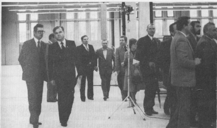
Otvoritve največjega novozgrajenega objekta v Zagorju so se udeležili nekateri vidni predstavniki družbeno političnega življenja SR Hrvatske in Slovenije.