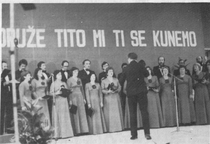
in Komorni zbor Peko.