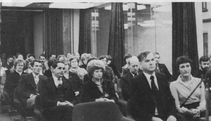
Udeleženci slavnostnega zasedanja ob 30-letnici samoupravljanja.