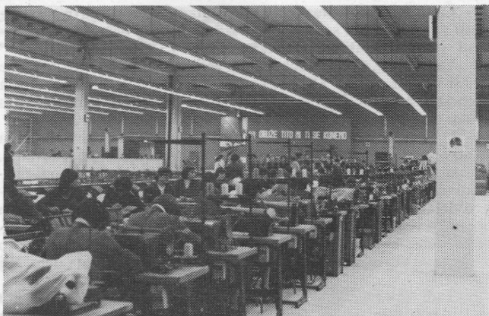
Šivalnica v novih prostorih.