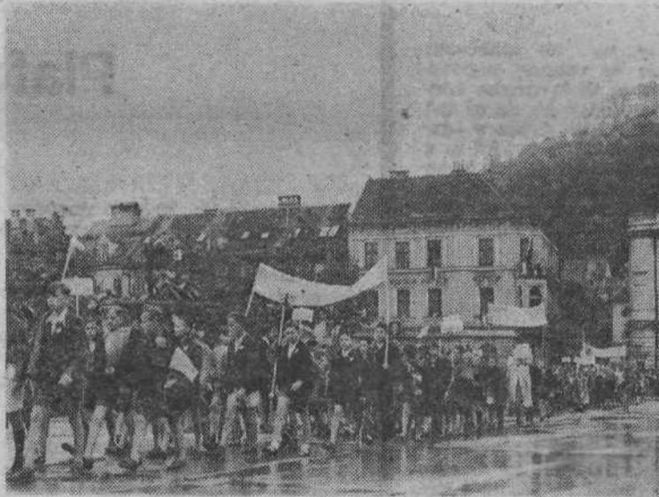
Prihod prve slovenske vlade je organizirano pričakala tudi ljubljanska mladina.

Medtem pa je bila borbena Ljubljana s tisoč vezmi povezana z osvobodilno vojsko. Zaščitniki in obveščevalci so se drzno prebijali iz ograjenega mesta in skozi fronto do štaba VII. korpusa, da so do potankosti poročali o dogajanjih