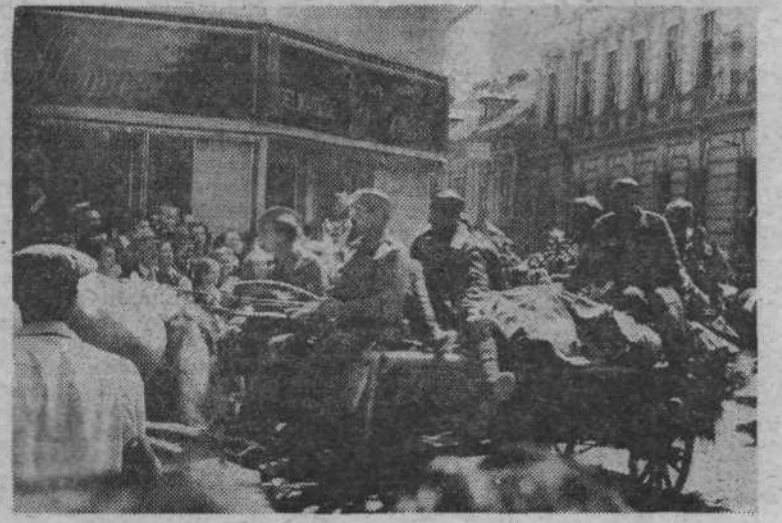
Mimohod partizanov, osvoboditeljev Ljubljane, 9. maja 1945 pred pošto.