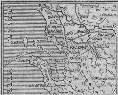
Der albanische Hafen Valona.

Z ozirom na sedanje vojne dogodke na Balkanu, zlasti z ozirom na prodiranje proti