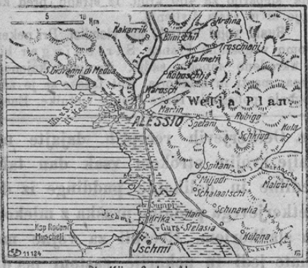
Die Kämpfe bei Alessio.

ter italijansko-srbskimi četami. V boljše razumevanje teh poročil prinašamo zemljevid Alessia in okolice.