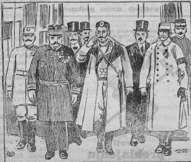
König Nikita in Lyon.

Kakor znano, jo je besedolomni črnogorski kralj Nikita popihal čez doline in gore, ko so se v bližini njegove rezidence prvi avstrijski bajoneti pokazali. Pobral je šila in kopita, prelomil še parkrat v naglici svojo balkansko „častno besedo“, naložil svoje ženske in prtljago ter jo popihal. Šel je najprve v Italijo. V Rimu ga je sprejel njegov zet „re piccolo“ Viktor Emanuel. Pa se menda nista mogla dogovoriti, mali kralj velike Italije ter veliki kralj male Črnogorske. Zato je Nikita zopet vstopil v vlak in se odpeljal na Francosko in sicer v mesto Lyon. Prinašamo ob tej priliki pač redko sliko prihoda kralja Nikite v Lyonu.