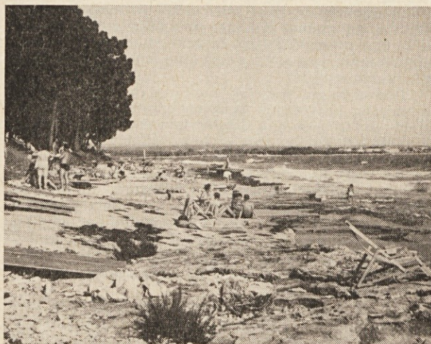
Vsem članom kolektiva želimo prijeten oddih

Pomemben je tudi pregled podatkov, ki kažejo stanje naših delovnih sredstev oz. osnovnih sredstev. Na-