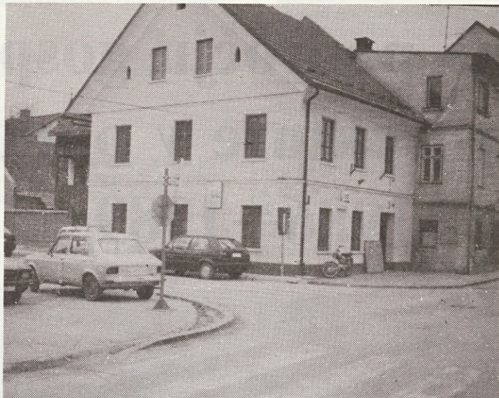
Vedno več starih stavb je obnovljenih, čakajo nas pa še mnoge. Tudi stavba nekdanje Delavske univerze je prenovljena nekaj povsem drugega kot prej.

V letu 1989 so bila najprej zaključena dela, ki so se pričela v preteklem letu. Tako je bil dokončno polqžen zaporni asfaltni sloj na lokalni cesti Sodraži-