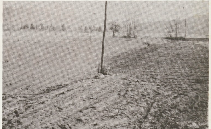
Dolenjevaško polje, dolga leta žrtev nenehnih poplav, je z izgradnjo zadrževalnika v Prigorici že boljše. Le še vodovja iz Obrha občasno poplavijo posamezne dele polja, pa tudi to bo z ureditvijo odtočnega kanala preko polja gotovo kmalu urejeno. Kanal (pogled nanj z glavne ceste proti Kočevju) pospešeno urejajo in polje med Dolenjo vasjo in Jasnico bo morda spet postalo to, kar je nekoč že bilo – v korist in naš skupen ponos.