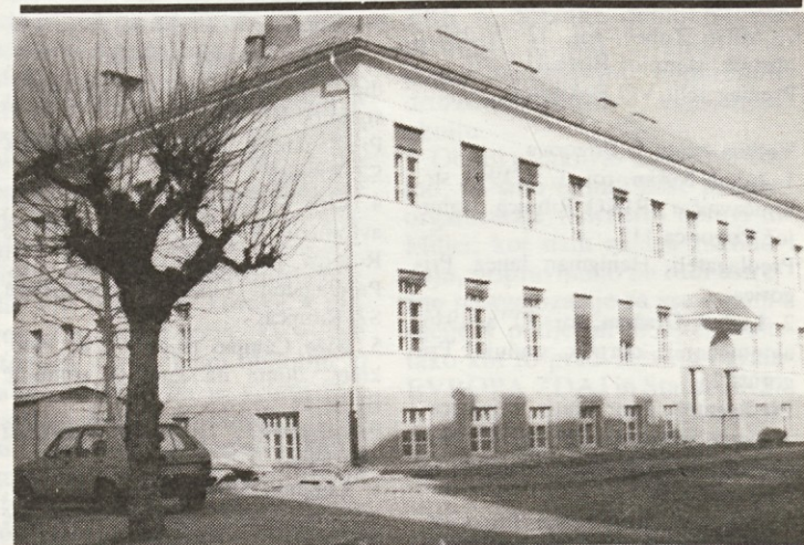
Pozno jeseni je bila dokončana tudi obnova ene starih osnovnošolskih stavb v Ribnici, na zunaj kot tudi znotraj. Obnavljanje šolskih prostorov se bo nadaljevalo tudi v prihodnjem obdobju.