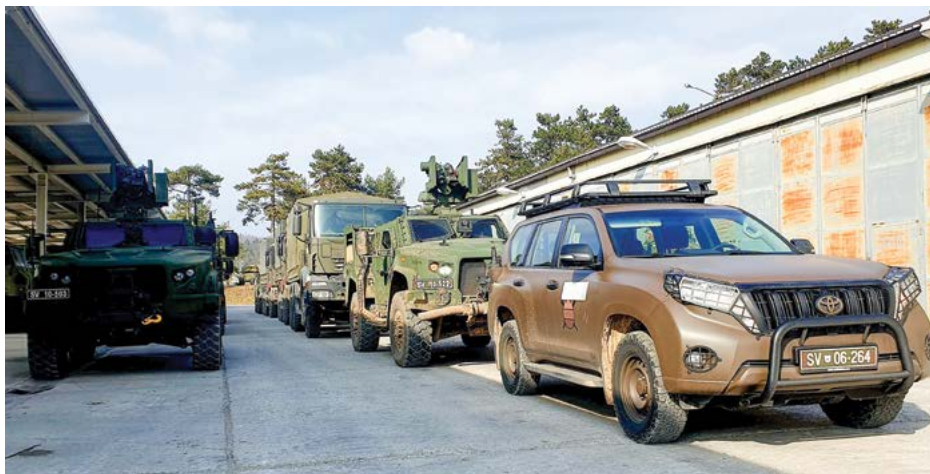
Priprava konvoja za premik v Vojašnici Stanislava Požarja v Pivki

mikov so se vozniki in vodje konvojev ob podpori Skupine za kontrolo premikov (SKP) spoznavali s pojmom administrativnih premikov znotraj ozemlja Republike Slovenije, znotraj EU in s specifikami poti v smeri delovanja SV zunaj meja EU (Kosovo; Kfor; Balkans Road Movement Request Form – BR MRF). Udeleženci so preverjali svoje znanje s pogoji cestnega transporta v skladu z zakonodajo in cestnoprometnimi predpisi v mirnodobnem času.