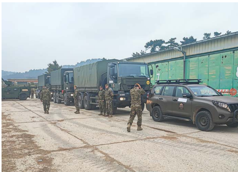
Priprava posadk logističnega konvoja v Vojašnici Stanislava Požarja v Pivki

V nadaljevanju so se urjenju premika konvojev tretji dan pridružili vozniki lahkih kolesnih oklepnih vozil (LKOV; JLTV – joint light tactical vehicle; Perun/Oshkosh) iz 72. brigade. Po osnovnem uvajanju v standardne postopke in naloge premika konvojev so se vozila s spremstvom premaknila na relaciji