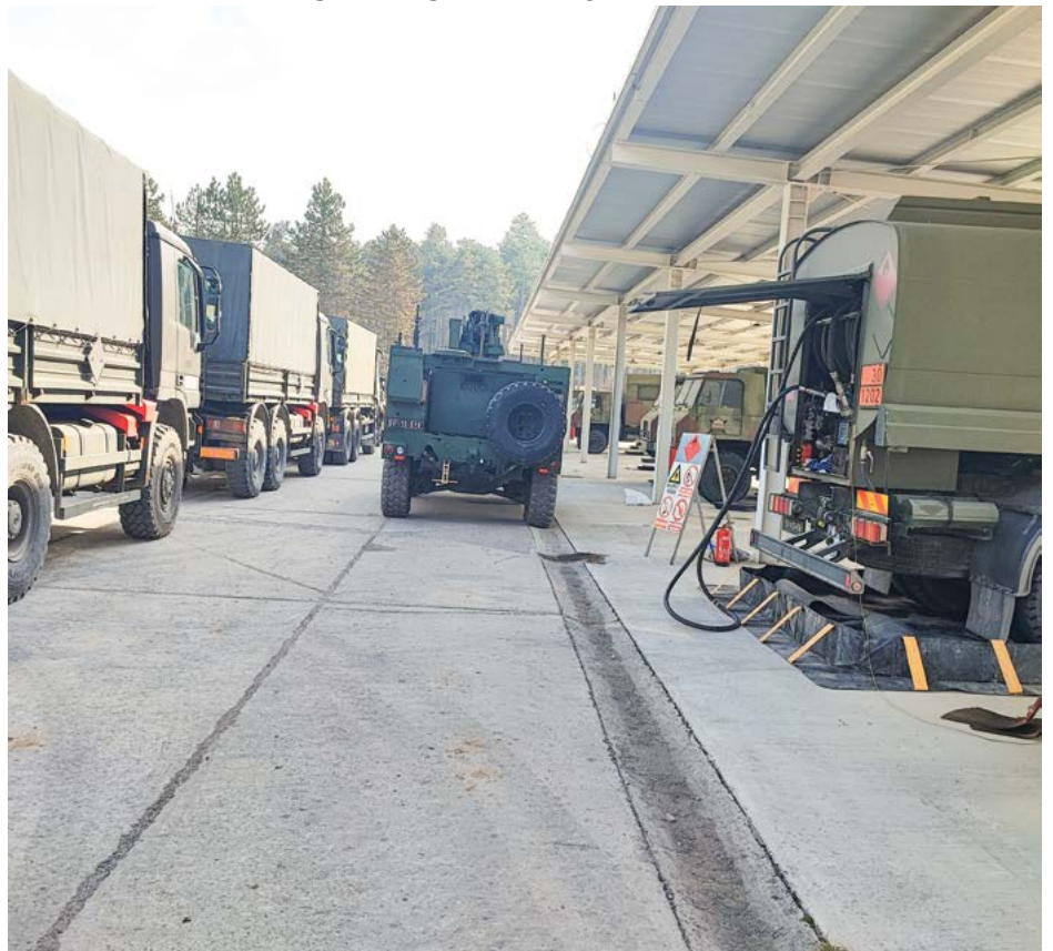
Popolnjevanje vozil v konvoju z gorivom (ACG), Vojašnica Stanislava Požarja v Pivki

njenosti), S-2 (izdelava zahtevkov za vojaško policijo, najava premikov po posameznih dnevih, nabava kartografskega gradiva), S-3 (izdelava ukaza, določitev cilja in namera usposabljanja, reference za usposabljanje), S-4 (zagotovitev vodje usposabljanja II. faze Lipicanec 23, zagotavljanje vodje logistike (dnevna oskrba/real life support), S-6 (zagotovitev radijskih naprav, programiranje radijskih naprav, izdelava načrta zvez in pogovornika). 670. LOGP je uspešno izvedel vse faze vaje Lipicanec 23 in celovito usposabljanje vseh segmentov logističnega delovanja.