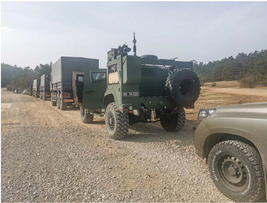
Postanek logističnega konvoja z bojnim spremstvom na vadišču Poček

Pivka–Postojna–Vrhnika–Borovnica. Zaradi slabih vremenskih razmer (goste megle) so vozniki perunov pridobili predvsem na območju Bistre (Tehniški muzej) bogate praktične izkušnje v vožnji v oteženih okoliščinah. V delovanje konvoja je bilo vnese-nih tudi nekaj individualnih veščin. Med te so spadali izvajanje zahtevka MEDEVAC (angl. MEDEVAC request), priprava pristajalnega območja za helikopter, načrtovanje zavarovanja konvoja. Poseben poudarek je bil na organizaciji in vodenju pohodne skupine kot organizacijskega dela konvoja.