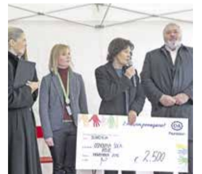
Donacija podjetja C&A Foundation Osnovni šoli Roje

Investitor FMZD, d. o. o., Spar Slovenija in trgovina C&A so na uradnem odprtju podarili donatorska sredstva društvom, ki delujejo v občini Domžale. Donacija FMZD, d. o. o., 4.000 evrov je prejelo Društvo diabetikov Domžale, donacija Spar Slovenija 4.000 evrov je prejelo Medobčinsko društvo invalidov Domžale in tretjo donacijo 2500 evrov trgovine C&A je prejela OŠ Roje za naše otroke s posebnimi potreba-