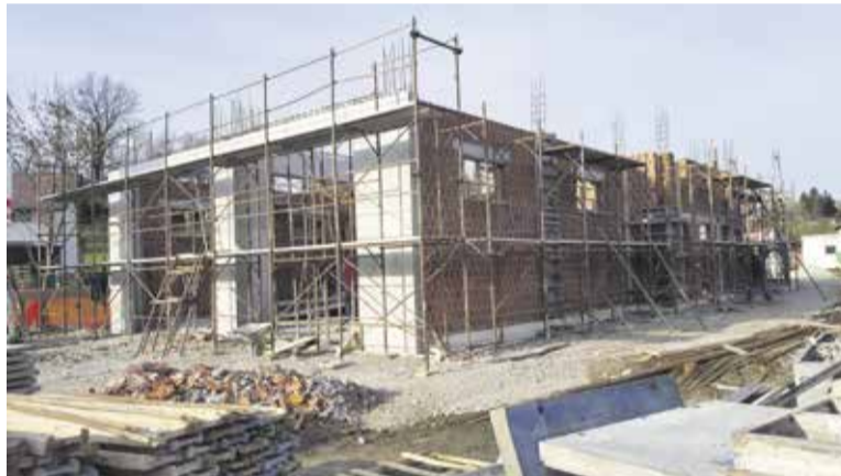
Dom krajanov – gasilski dom Studenec