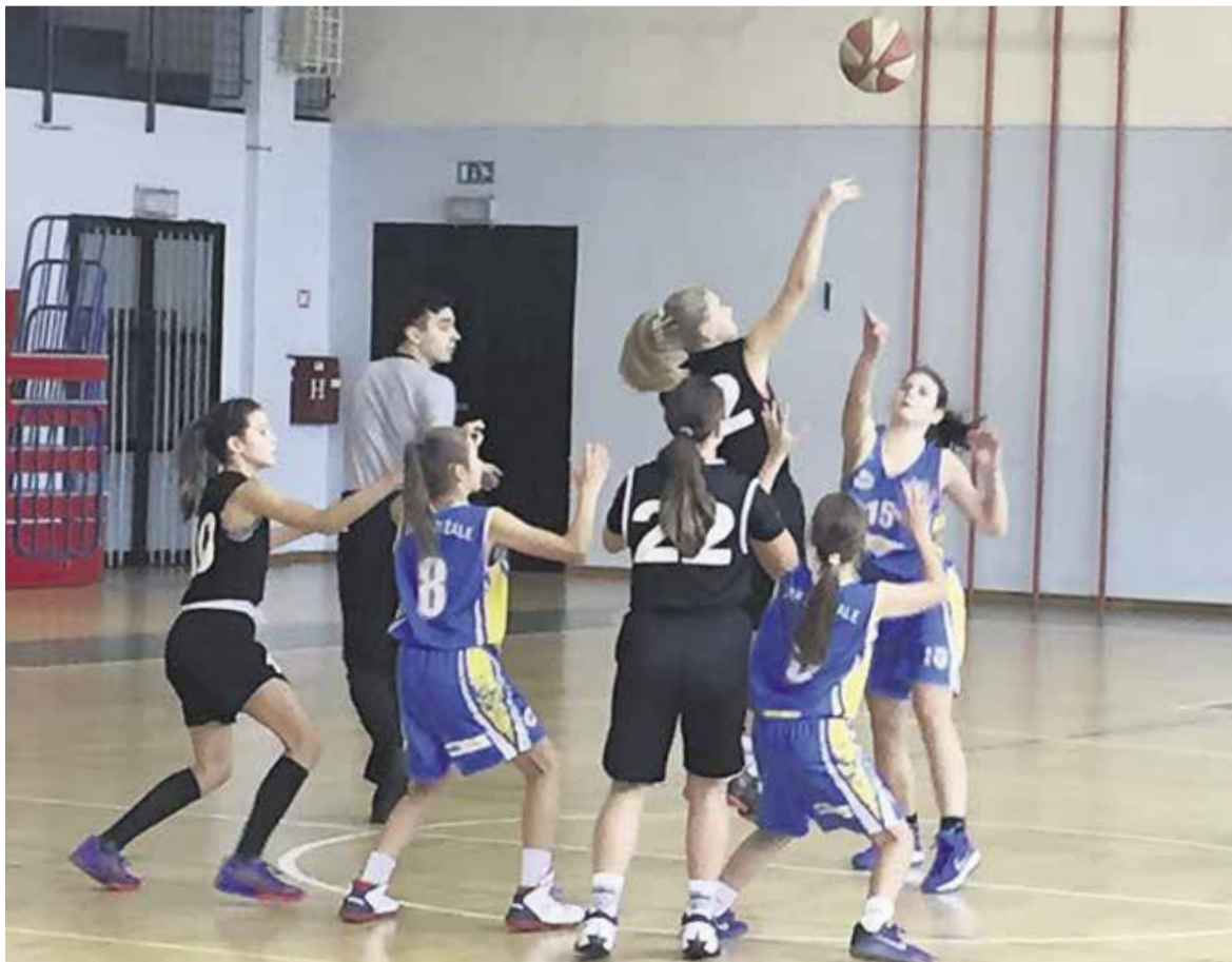
Dekleta ŽKK Domžale

Dekleta, pridružite se, košarka je zakon! Za vse novinke vadba prvi mesec brezplačna! http://zkkdomzale.si/