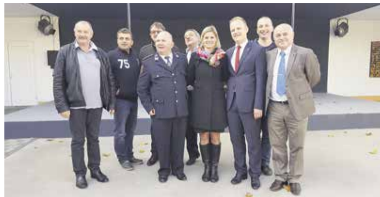
Domžale in Koprivnica sta sporazum o sodelovanju in prijateljstvu ponovno podpisali leta 2011.

Občinski svet (Gradsko vijeće) je leta 1993 sprejel odlok, v katerem so datum 4. november proglasili za dan mesta Koprivnica (Dan Grada Koprivnica).