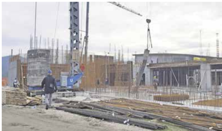
Gradnja podružnične osnovne šole v Ihanu

V juniju je bila zaključena gradnja brvi čez Radomljo v Dobu, s katero smo vzpostavili nove povezave med posameznimi območji naše občine. Konec letošnjega leta bomo začeli