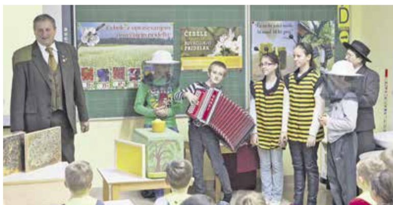
Učenci OŠ Dob so pod mentorstvom g. Kodermana pripravili učno uro o čebelah

Medeni zajtrk – tradicionalni slovenski zajtrk tudi v občini Domžale praznuje prvih deset let uspešne poti, polne znanja o čebelah, medu in drugih njihovih proizvodih, ki skupaj z lokalno pridelanim maslom, kruhom, mlekom in sadjem, predstavljajo zdrav zajtrk za vse naše otroke. Čebelarsko društvo Krtina, Dob je tako tudi