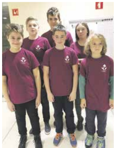
Mladi domžalski šahisti v majicah ŠD Domžale

Straže, Kaja Grošelj in Gal Juvan je zasedla 11. mesto, zbrala je 14 točk, druga ekipa pa 16. mesto, osvojila je 12,5 točke. Igralci so imeli na voljo 20 minut in 10 sekund dodatka na potezo; sodelovalo je 21 moštev. Udeležba je bila sicer zelo močna. Zmagal je Triglav Krško, 23, s Petrom Urbančem na prvi deski, drugi je bil Kočev-