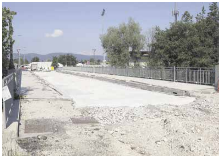
Letos v poletnem času je bil obnovljeno tudi cestišču na mostu Repovž

li s projektom obnove (Mlinarske) brvi med Homcem in Nožicami, gradbena dela pa naj bi se predvidoma začela v začetku leta 2017.