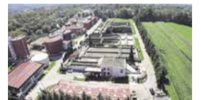
CČN pred začetkom nadgradnje v letu 2013.

Nadgrajeni sistem CČN vključuje tri glavne procesne sklope, ki obsegajo: nov vstopni objekt, ki dopolnjuje obstoječo mehansko stopnjo, novo aerobno biološko stopnjo z napredno tehnologijo sekvenčnih reaktorjev (SBR) in novim postopkom deamonifikacije in obstoječo anaerobno biološko stopnjo s proizvodnjo bioplina in kogeneracijo. Napredni sekvenčni reaktorji (SBR) vključujejo anaerobni selektor za delno biološko odstranjevanje fosforja in simultano nitrifikacijo in denitrifikacijo, ter moderen in