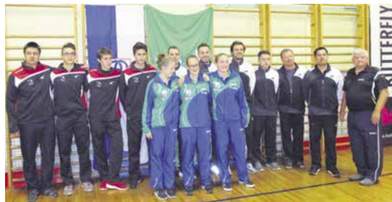
Naši tretje in prva ligaška ekipa ter naše reprezentantke, skupaj z nekaterimi člani vodstva Namiznoteniške sekcije Mengeš

Nekaj informacij z ligaških in pokalnih tekmovanj. Naša ekipa v 1. namiznoteniški ligi je izgubila z aktualnimi podprvaki NTK Kemo iz Puconcev z 2:5, izgubila je tudi v gosteh z aktualnimi državnimi prvaki NTK Krko iz Novega mesta z rezultatom 0:5, po porazu v 5. krogu proti ekipi NTK Murska Sobota s 3:5 pa zaseda trenutno 7. mesto v 1. SNLT. Priložnost za dvig na lestevici bo že 26. novembra, ko se bo v doma-