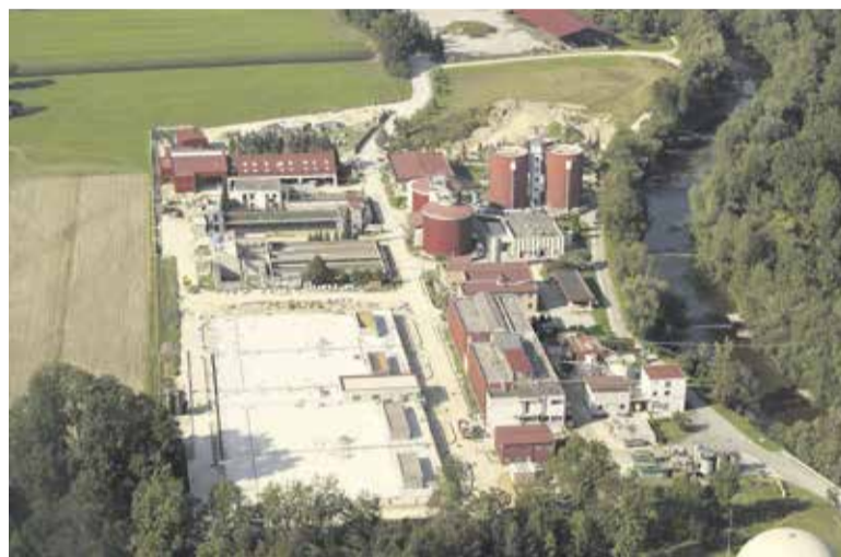
Nadgrajeni sistem CČN vključuje tri glavne procesne sklope: nov vstopni objekt, novo aerobno biološko stopnjo in obstoječo anaerobno biološko stopnjo.

Doslej so v JP CČN vsa leta kakovostno čistili komunalno in industrijsko odpadno vodo z domžalsko-kamniškega območja. Obstoječa tehnologija je z leti postala zastarela in z uveljavitvijo novih zakonsko predpisanih vrednosti, ki so začele veljati v letu 2016, ne bi več zagotavljala ustreznega čiščenja odpadne vode. Občine lastnice so se zato odločile za nadgradnjo na terciarno čiščenje. To je obsegalo izgradnjo novih aerobnih bioloških stopenj, ki vključuje tudi čiščenje dušikovih in fosforjevih snovi ter novega vstopnega objekta za sprejem večje količine odpadne vode z ustreznim predčiščenjem. Nadgrajena čistilna naprava ima zmogljivost 149.000 PE in sprejema odpadno vodo gospodinjstev, ki so priključena na kanalizacijski sistem in greznične gošče ter blato malih komunalnih čistilnih naprav. Skladno z okoljevarstvenimi dovolje-