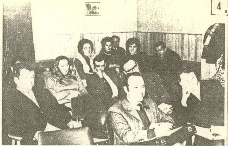
IZ 52. ZASEDANJA DS DNE 3.II.1970

Na 52. zasedanju delavskega sveta našega podjetja je bil potrjen tudi sporazum o poslovno tehničnem sodelovanju s podjetjem DELINGRAD iz Aleksinca. To je trgovsko podjetje na veliko in malo. Bistvo sporazuma o sodelovanju s tem podjetjem je, da bomo od njih dobili vse njihove količine barvnih in belih kovin v letu 1970, oni pa bodo dobili od nas več 10 milijonski enoletni kredit. S sporazumom so določene cene odpadnemu blagu in obresti za kredit. Pravtako so določene sankcije, v kolikor bi ena ali druga stranka prekršila sporazum ali predčasno od njega odstopila.