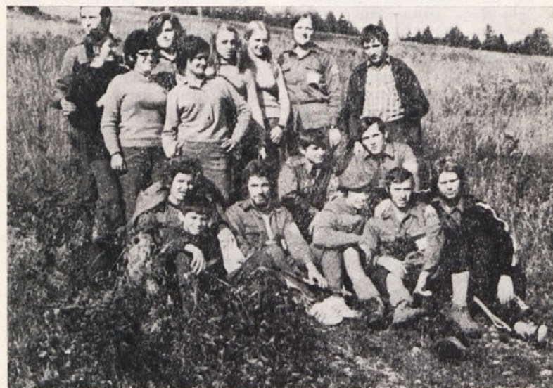
Pot je bila naporna, obrazi pa so kljub temu veseli.

V Mojstrani smo zavili v dolino Vrat. Ustavili smo se pri slapu Peričnik. Z lesenega mostu smo občudovali slap in njegovo okolico. Nato smo se odpeljali do Aljažvega doma. Ta je že 1015 metrov visoko. Po kratkem počitku in zajtrku smo krenili proti vrhu. Kmalu smo naleteli na prve krpe snega. Tega je bilo vedno več. Nazadnje že ni bilo nobene gazi. Vodiči so nas vodili ob markacijah, ki so označene na vidnejših skalah. Pot je bila težka in strma, razgled pa vedno lepši. Hodili smo že več kot dve uri. Iznemada sta