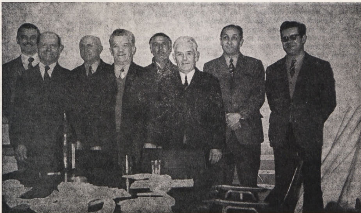
Kot je v navadi so se tudi letos, upokojenci, ki so odšli v pokoj po 1. septembru 1972, fotografirali na svoji slavnosti, skupaj s predstavniki podjetja in DS. Kratko poročilo berite na 2. strani.

— z družbenim dogovorom je treba do stanovanjskih kreditov zavzeti tak odnos, da ne bo mo-