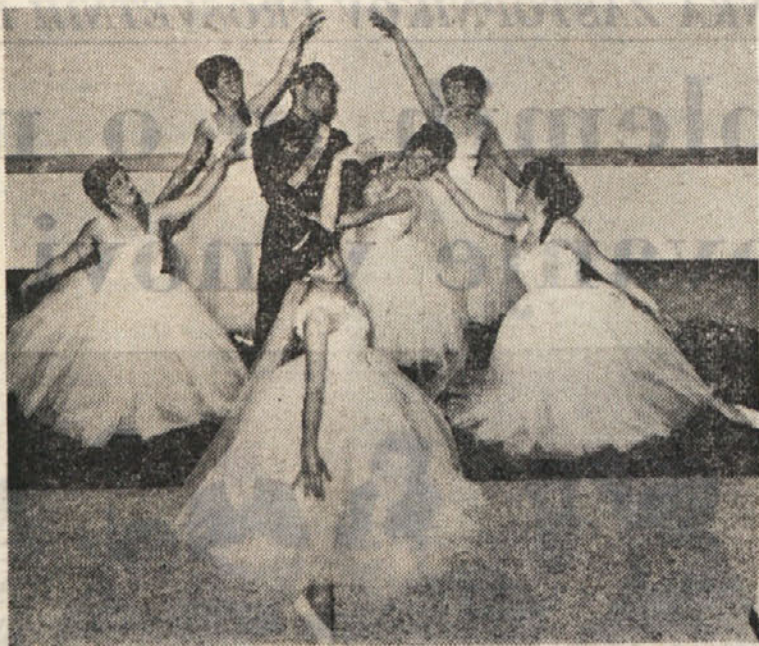
Prizor iz Willesove baletne šole

niti ne starostne dobe prijaviteljnih, saj bo sprejel v šolo vse, ki čutijo ljubezen do klasičnega baleta od 6. leta starosti dalje, dečke in deklice. Vaje bodo od sredine oktobra do konca maja dvakrat na teden, šolski pouk pa se bo zaključil z nastopom, po možnosti v Kulturnem domu, kar