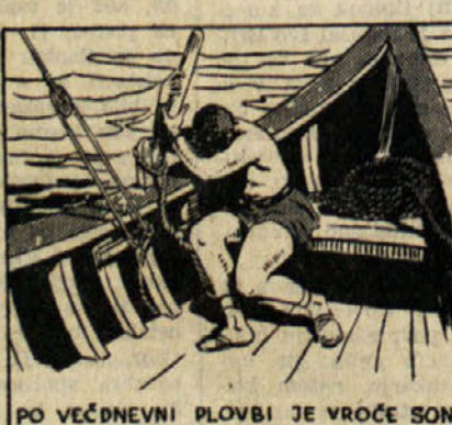
PO VEČDNEVNI PLOVBI JE VROČE SONCE USPAVALO KRMARJA IFIDA.