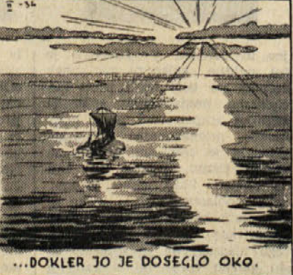
...DOKLER JO JE DOSEGLO OKO.