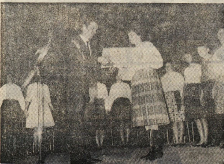
Z gostovanja ansambla «Tamburica» v Steverjanu