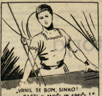
VRNIL SE BOM, SINKO! RASTI V MOČI IN SREČI!