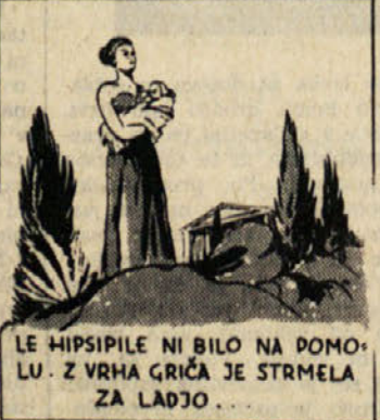
LE HIPSIPILE NI BILO NA POMOLU. Z VRHA GRČIČA JE STRMELA ZA LADJO.