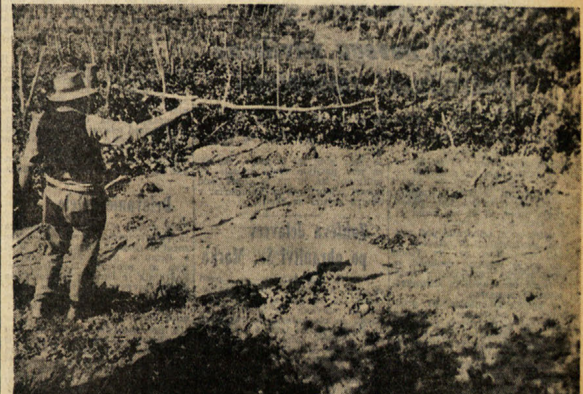
Zaradi neobičajno močnih nalivov je nastal na Oslavju zemeljski usod, ki meri več stotin kubičnih metrov, saj se je premaknila zemlja v dolžini kakih 80, v širini 40, v globini pa tudi do 3 metre. Usod je nastal na posevkih kmetovalcev Sfiligoja iz Klanjskega in Oslavju. Zemlja se je najprej premaknila v Sfiligojevem vinogrodu, voda pa je potem naplavila v Klanjskega. Škoda znaša več sto tisoč lir. Na sliki Sfiligoj, ki kaže na razdejanje v vinogrodu