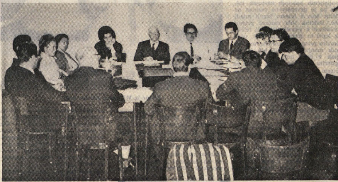
Prva seja novoizvoljenega odbora Slovenske prosvetne zveze

Obsežno so predstavniki prosvetnih društev razpravljali tudi o vpisovanju otrok v slovensko šolo, zavedajoč se, da imajo tudi pri tem člani prosvetnih društev veliko nalogo. Zlasti nekatera društva so pri tem pokazala veliko prizadevnost in tudi uspehe, sicer pa so v prepri-