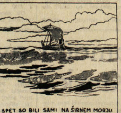
SPET SO BILI SAMI NA ŠIRNEM MORJU.