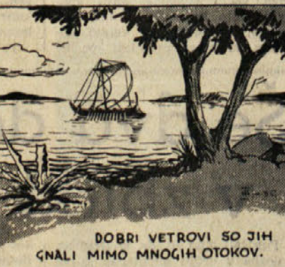
DOBRI VETROVI SO JIH GNALI MIMO MNOGIH OTOKOV.