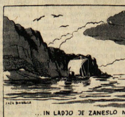
...IN LADJO JE ZANESLO NA VZHODNO STRAN OTOKA IMBRA.