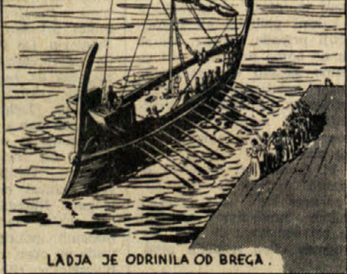
LADJA JE ODRINILA OD BREGA.