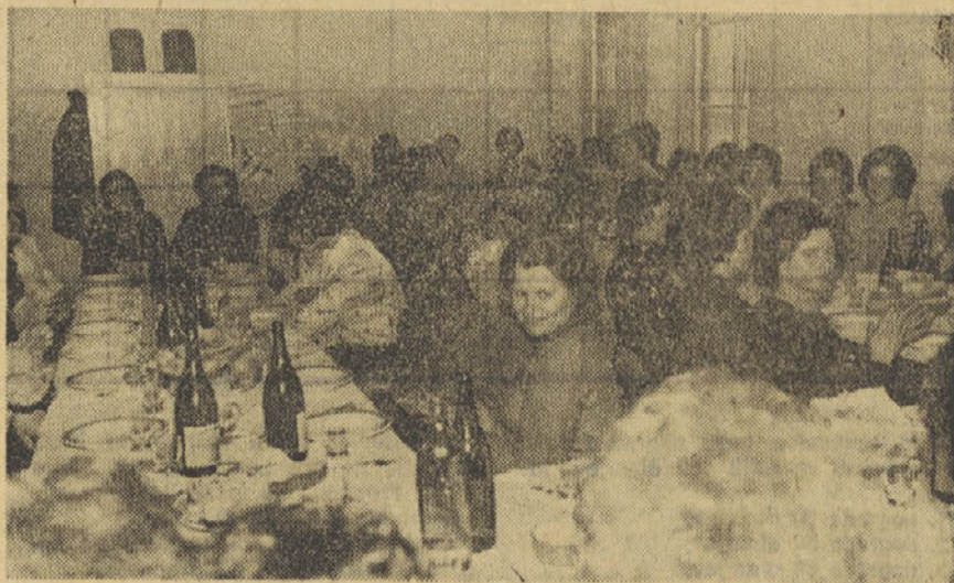
Letošnje praznovanje mednarodnega praznika žena v bistriški steklarni je poteklo v tradicionalno slovesnem vzdušju. Ker je veliko na novo sprejetih delavk prvič praznovalo med našimi ženami, je bil to tudi dan novih poznanstev s članicami kolektiva.

Sahovsko moštvo Steklarne iz Slovenske Bistrice se je udeležilo tekmovanja v okviru delavskih športnih iger. Med skupno 13 moštvi so se uvrstili na 6. mesto. Za tak uspeh imajo največ zaslug Vreš, Katanič in Smolar. Uspeh bi lahko bil še večji, če bi imeli na četrti deski bolj stalnega člana, saj so prav točke s četrte deske odločale o posameznih izidih. V. H.